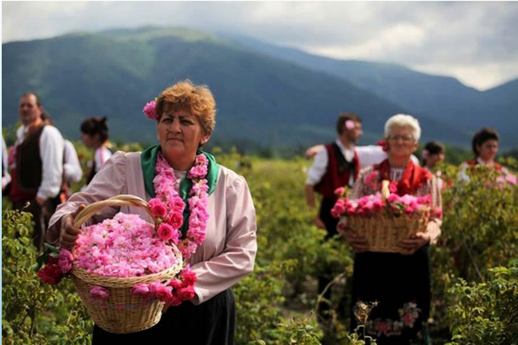
Страна розового масла - Болгария.