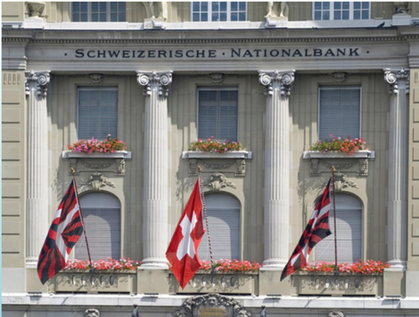
Страна банкир - Швейцария.