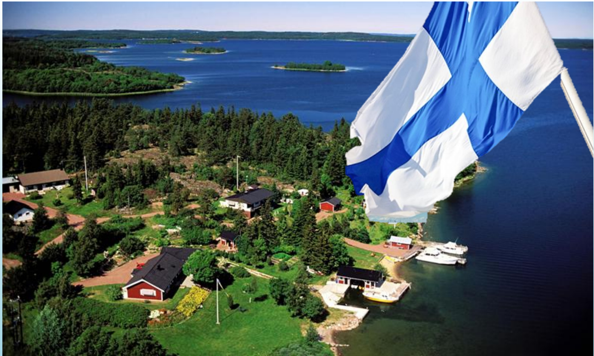
“Лесной цех” Европы - Финляндия.