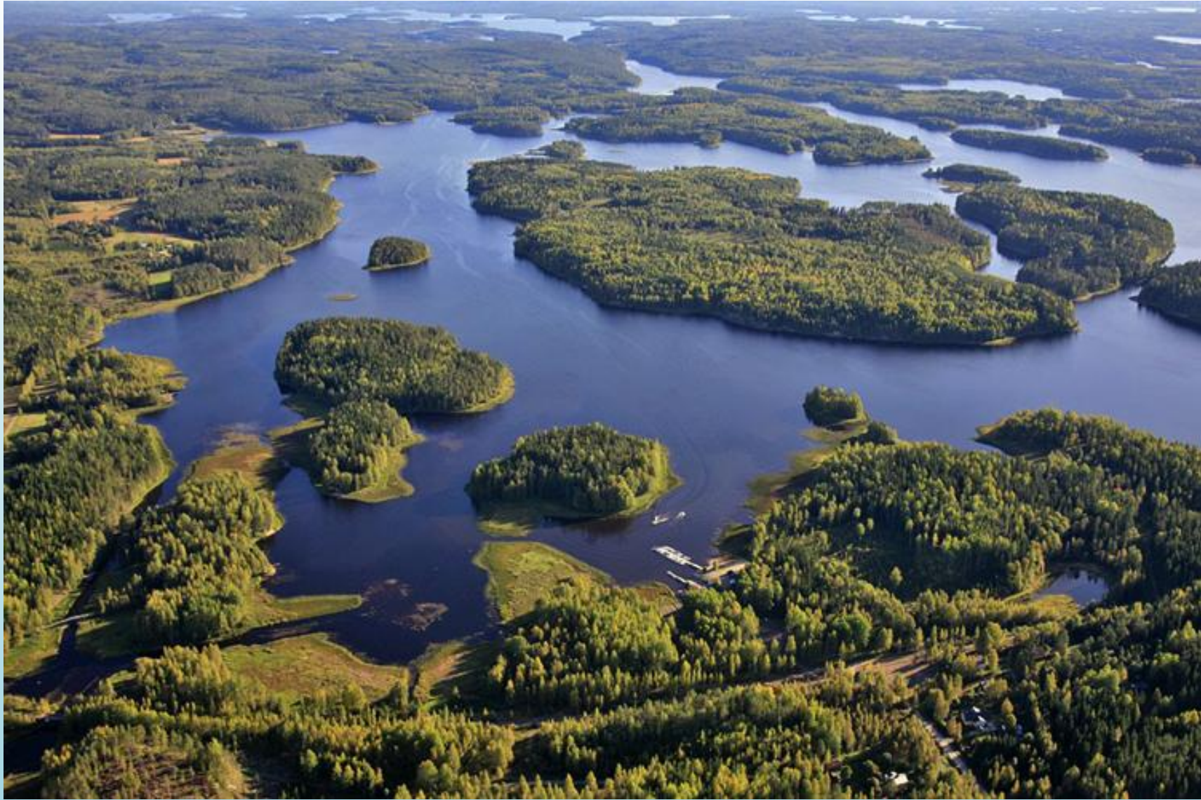
Страна 80 тысяч озёр - Финляндия.