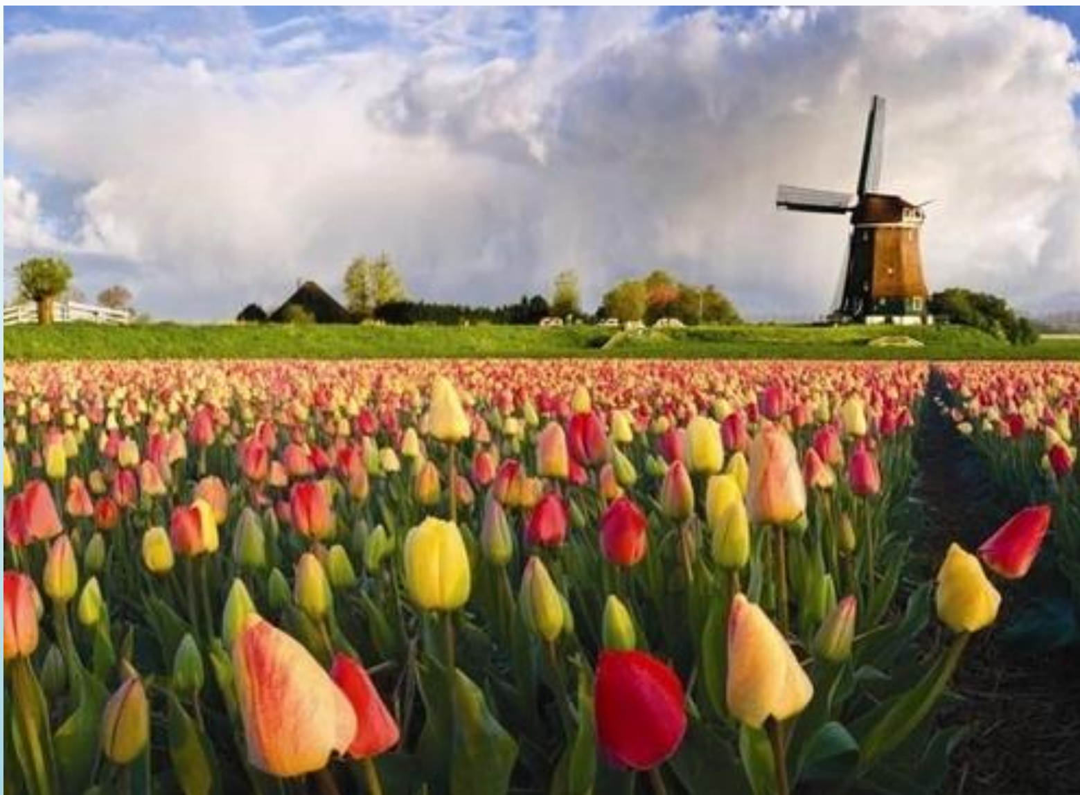
Страна тюльпанов - Нидерланды.