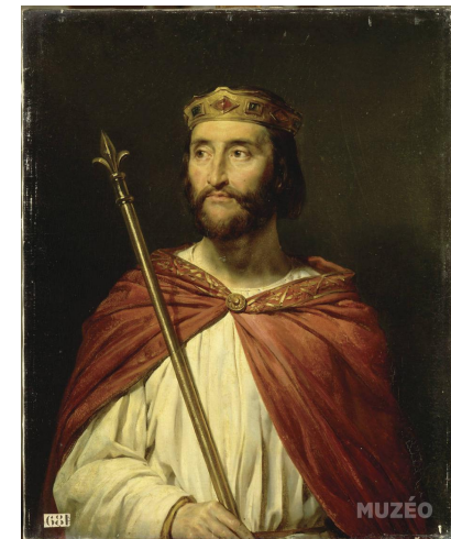
Людовик II Немецкий