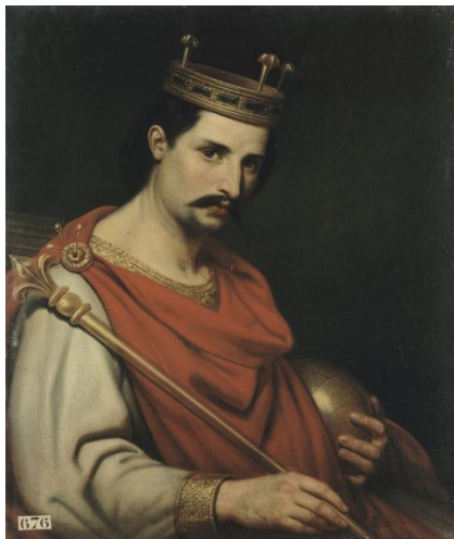
Карл II Лысый

Образование самостоятельного государства во Франции явилось прямым следствием становления феодальных отношений во Франкской империи, раздел которой был зафиксирован в 843 году Верденским договором . По этому договору Карлу Лысому, ставшему первым французским королем, достались земли к западу от Рейна. Французское королевство прошло в своем развитии этапы сеньориальной монархии (IX–XIII вв.), сословно-представительной монархии (XIV–XV вв.) и абсолютной монархии (XVI–XVIII вв.)