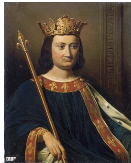
Филипп IV Красивый

Король Филипп Красивый бросил вызов римскому папе Бонифацию VIII, потребовав от французского духовенства субсидий для ведения войны с Фландрией и распространив королевскую юрисдикцию на все привилегии клира. В качестве ответной меры папа издал в 1301 году буллу, в которой грозил королю отлучением от церкви. Этот конфликт закончился победой королевской власти над духовной.