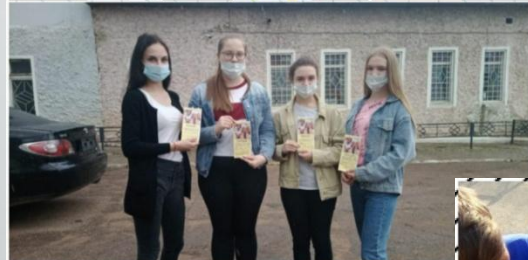
Проведение Дня защиты детей