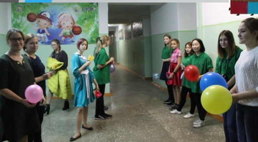
Концерт ко Дню матери