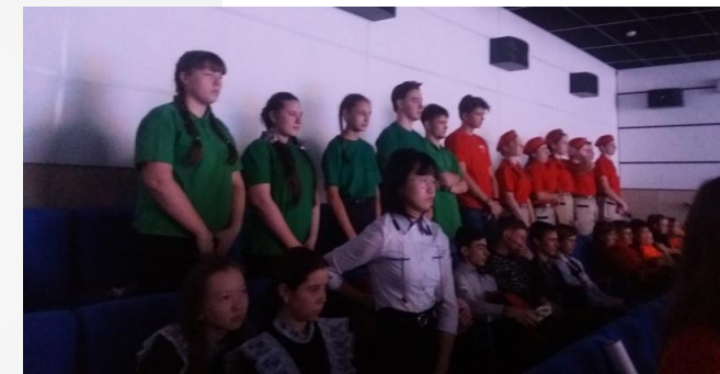
Участие в I районном слете волонтеров Мухоршибирского района