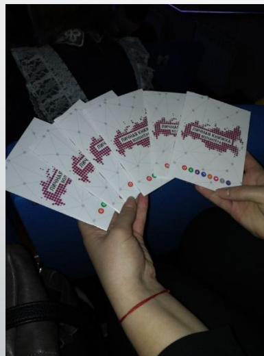
Получение волонтерских книжек