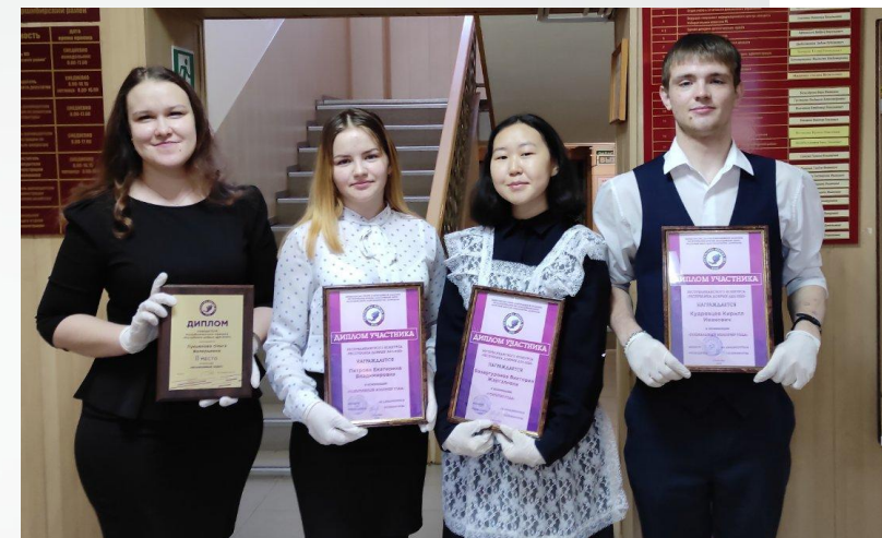
Участники республиканского конкурса «Республика добрых дел - 2020»