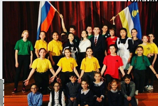
Концерт, посвященный дню толерантности «Планета толерантности»