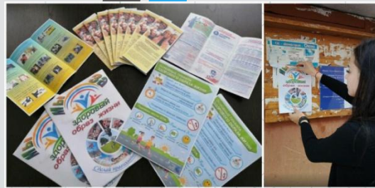
Акция «Мы выбираем ЗОЖ»