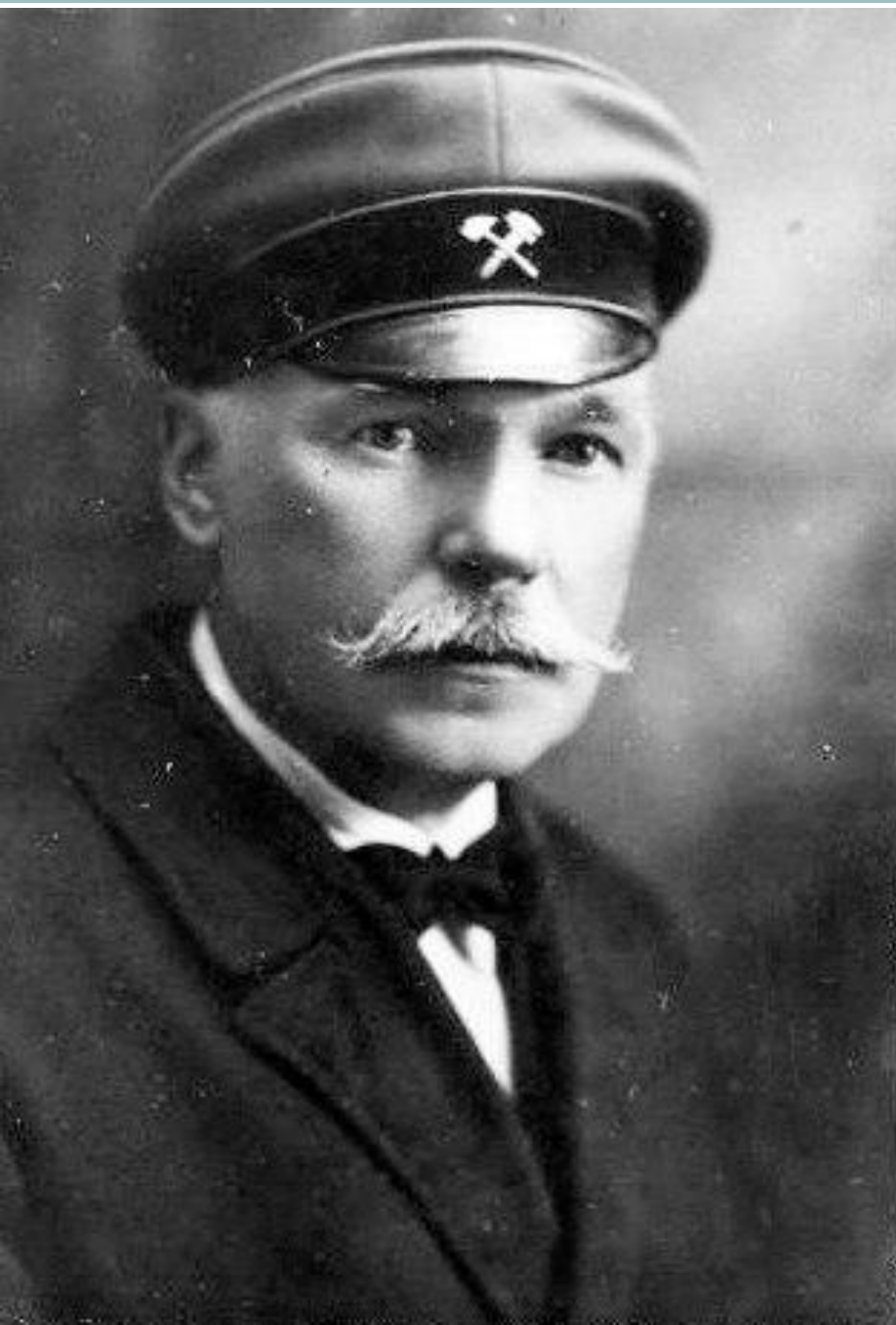
Vladimir Grigoryevich Fyodorov