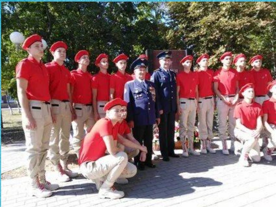
Чурилов Юрий Иванович, Герой Советского Союза, лётчик морской авиации на встрече с эртильскими юнармейцами 10 сентября 2020 года