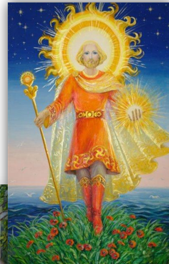
Ярило бог солнца