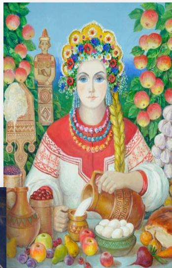
Макошь божество плодородия