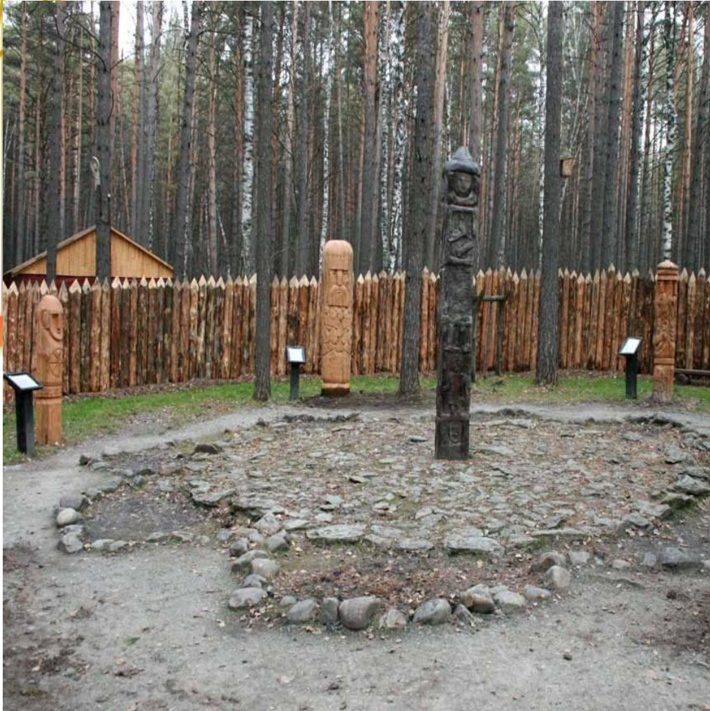
Капище и идола древних славян Историко-культурный и природный музей-заповедник Томская писаница