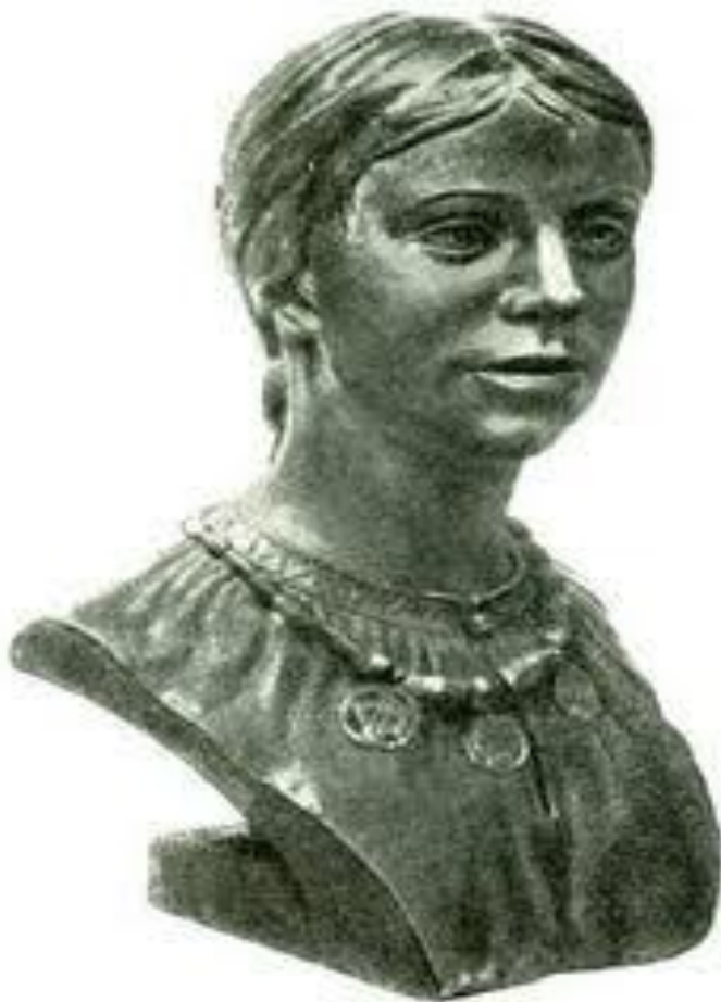
Женщина из племени вятичей