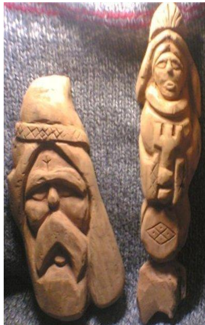
Славянские боги Сварог и Мокошь