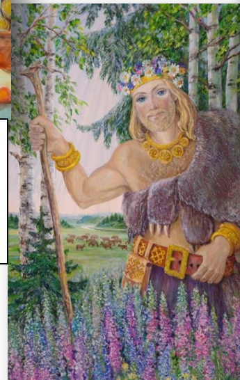
Велес покровитель скотоводства