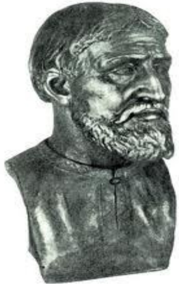
Мужчина из племени кривичей