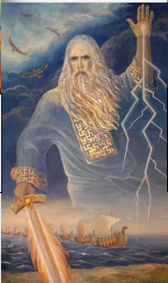
Перун бог грома и молний