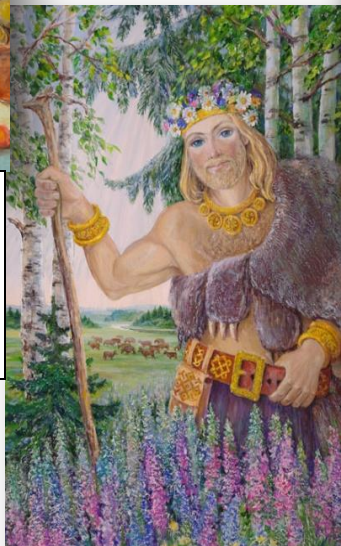
Велес покровитель скотоводства