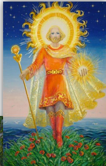
Ярило бог солнца