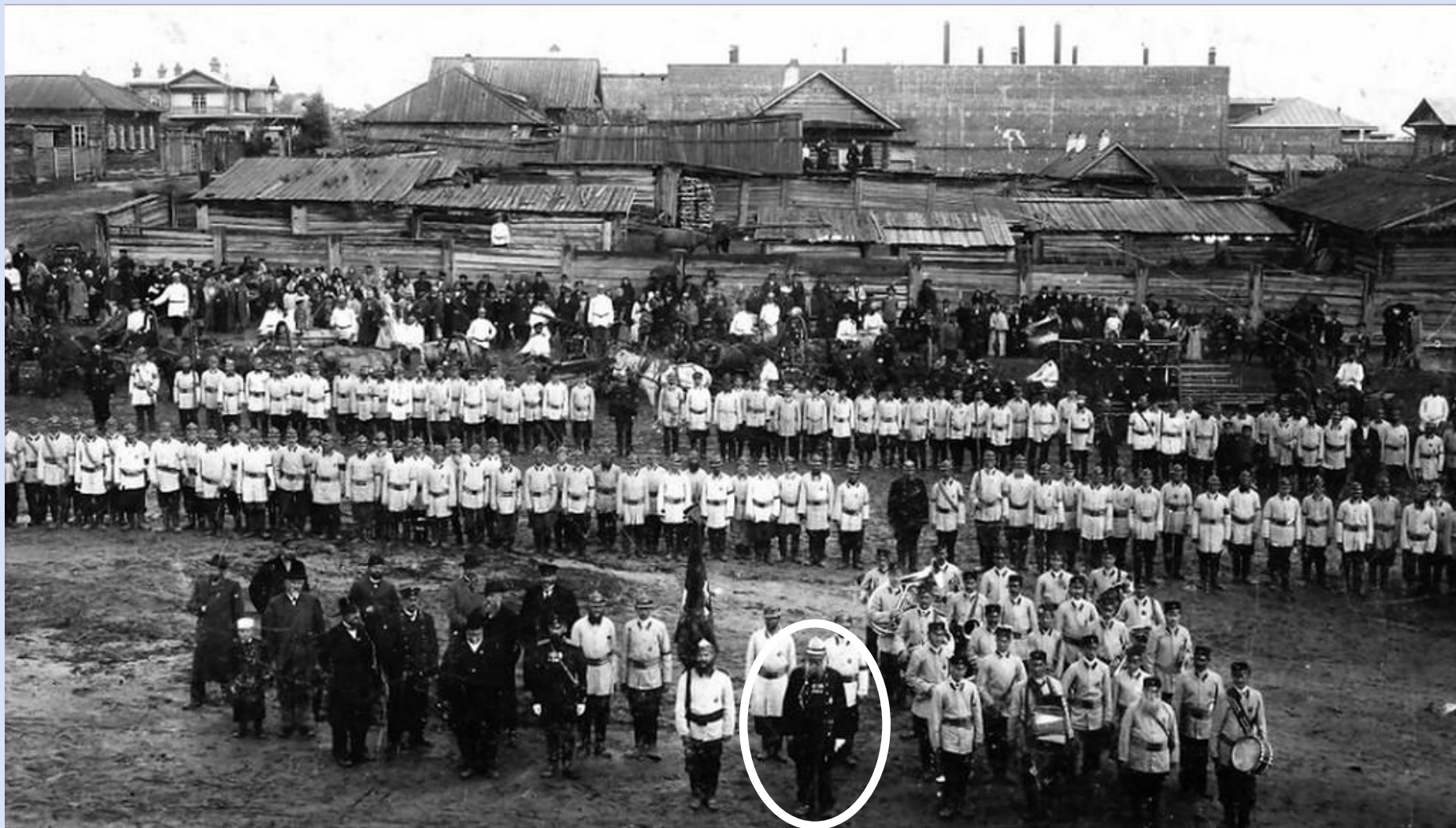
Парад Барнаульского вольно-пожарного общества. 1903 г.