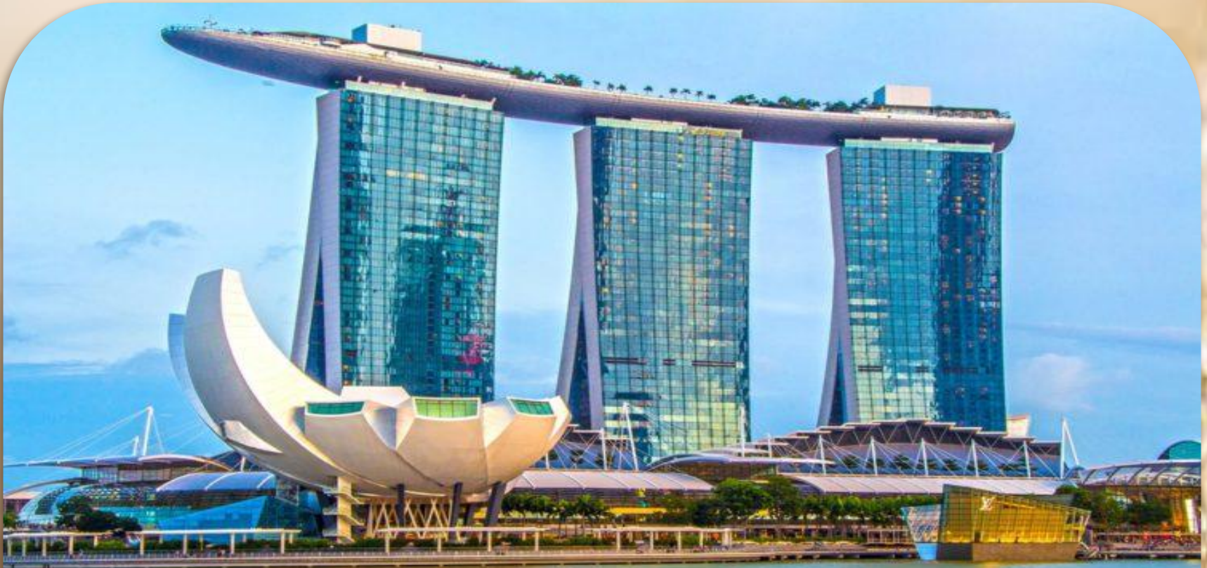
Отель Марина Бэй Сэндс

Помимо непосредственно номеров отеля, здесь есть всё, чтобы с пользой провести время: казино, конференц-залы, скай бар с невероятной панорамой города, шикарный бассейн, огромный торговый центр. Здание отеля имеет уникальное исполнение - три высотных башни объединены единой крышей-платформой в форме большого корабля.