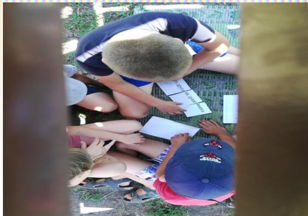
Рисование «Петя - петушок»