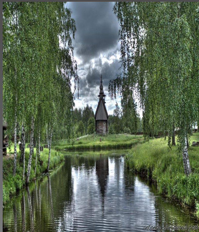
Музей-заповедник «Комстро́тская слобода».