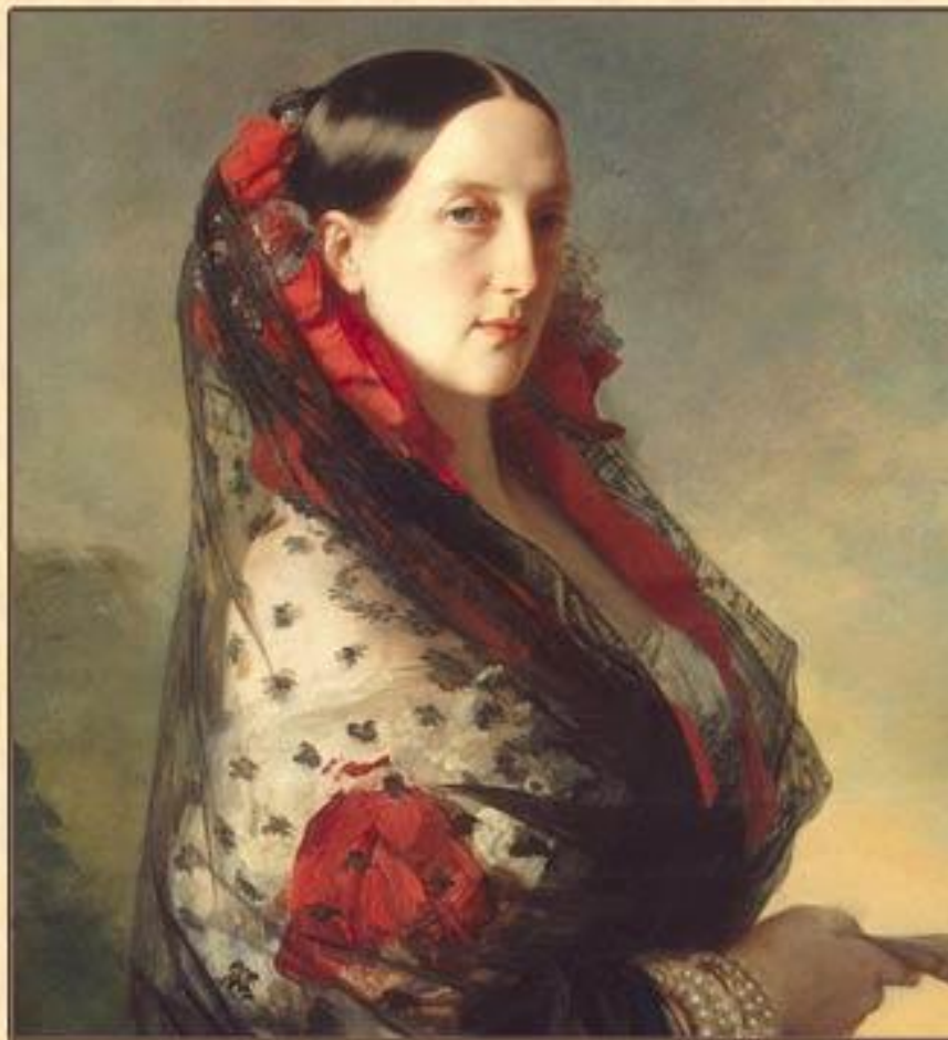
ПОРТРЕТ МАРИИ НИКОЛАЕВНЫ КИСТИ ФРАНЦА КСАВЬЕ ВИНТЕРГАЛЬТЕРА. ГОСУДАРСТВЕННЫЙ ЭРМИТАЖ, САНКТ-ПЕТЕРБУРГ