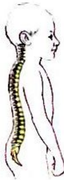
В 6-10 лет