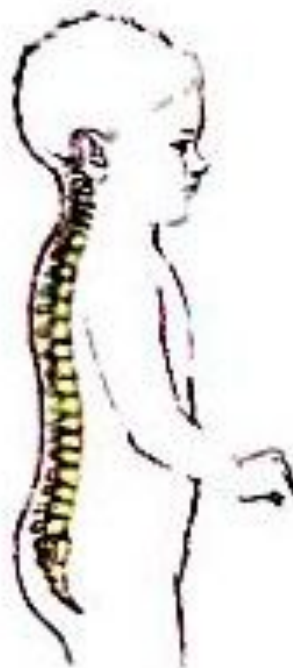
В 1-3 года