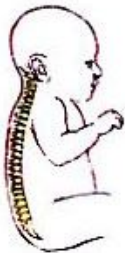
В 3-9 месяцев