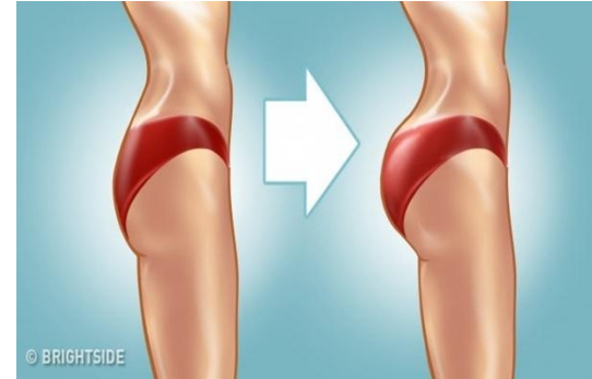
den Po aufpolstern/aufspritzen