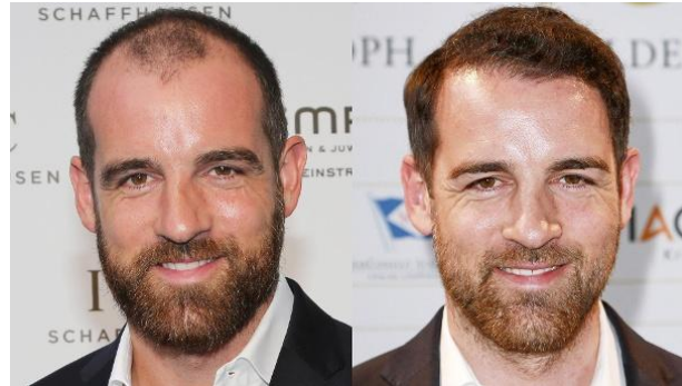
sich Haare verpflanzen