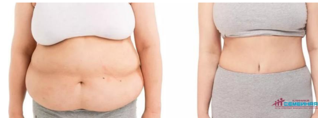
das Fett absaugen