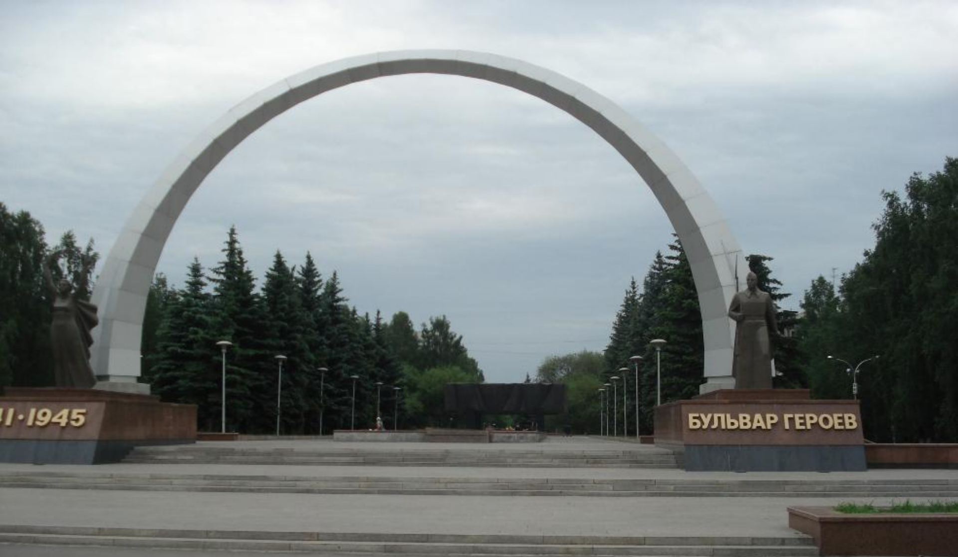
Мемориальный комплекс «Бульвар Героев»