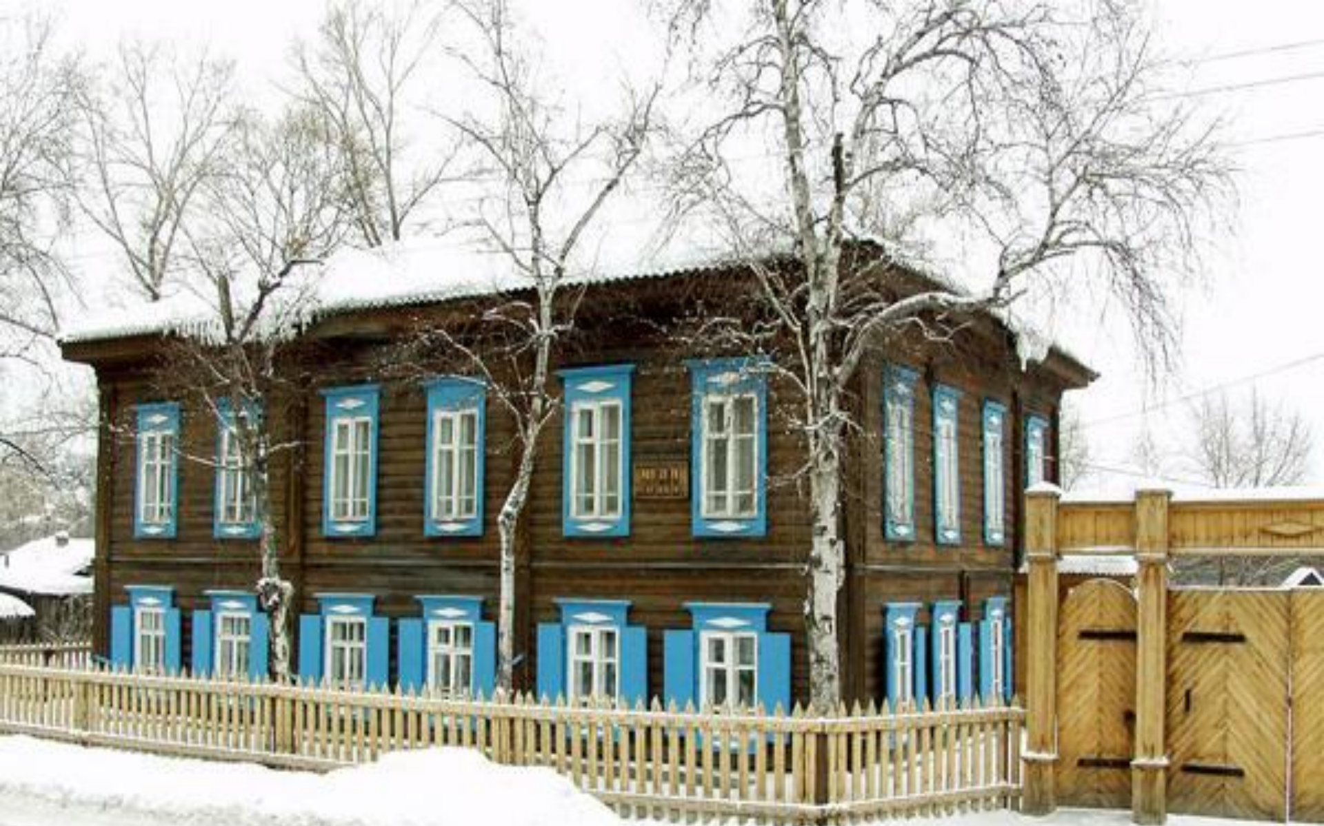
Дом-музей Ф.М. Достоевского