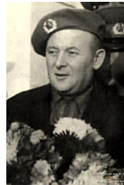
Константин Яковлевич Ваншенкин