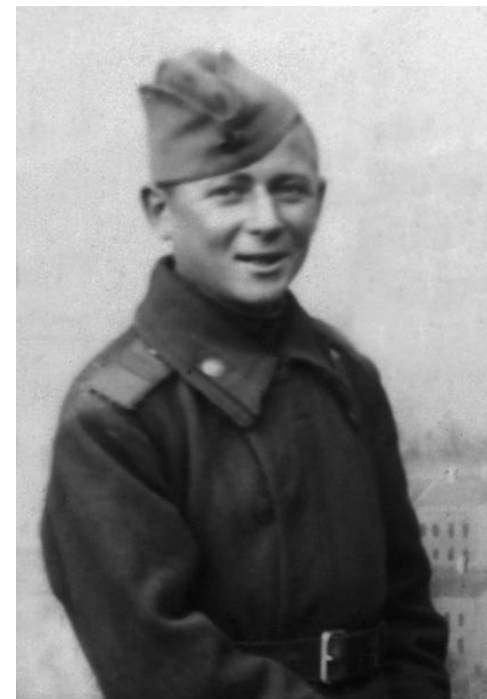
Константин Яковлевич Ваншенкин на фронте