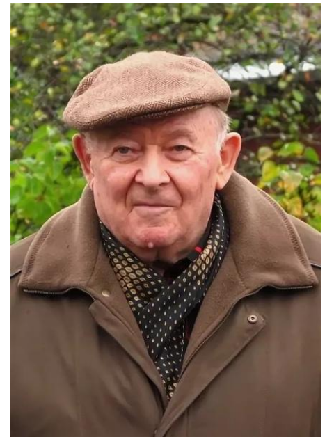
Константин Яковлевич Ваншенкин

Автор повестей «Армейская юность» (1960), «Авдюшин и Егорычев» (1962), «Большие пожары» (1964), «Графин с петухом» (1968), рассказов и др.