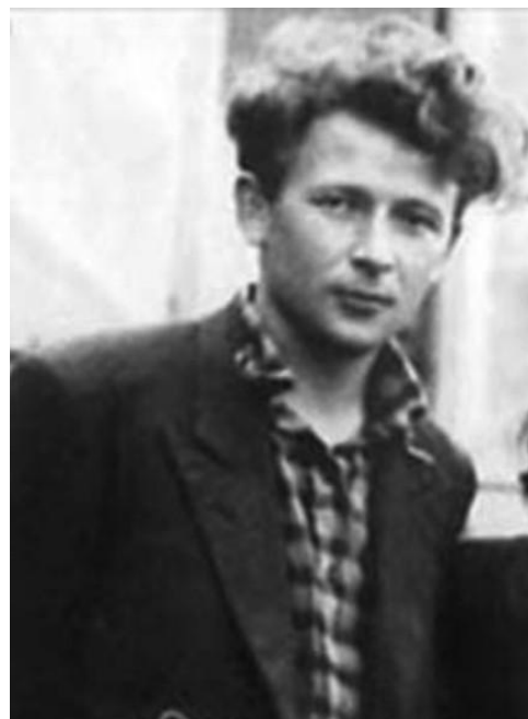
Константин Яковлевич Ваншенкин в юности