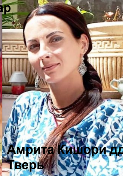
Амрита Кишори дд Тверь