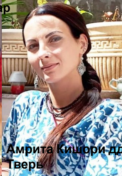
Амрита Кишори дд Тверь