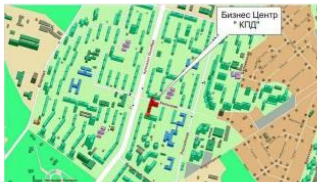
Нерегулярная, или свободная