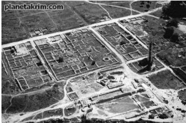
Регулярная, или прямоугольная