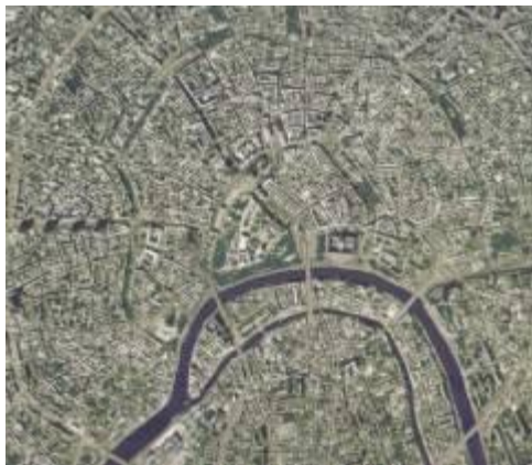
Радиально - кольцевая