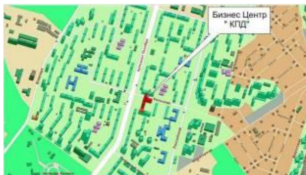
Нерегулярная, или свободная