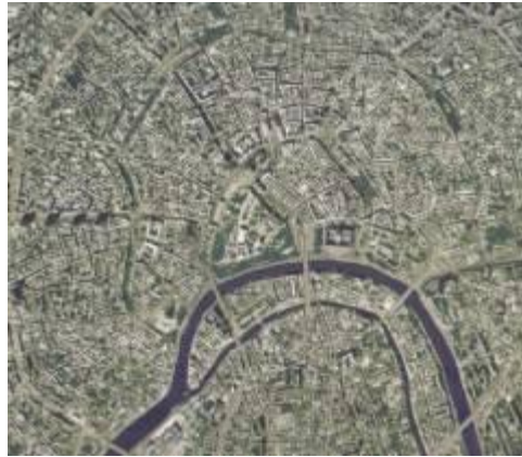
Радиально - кольцевая