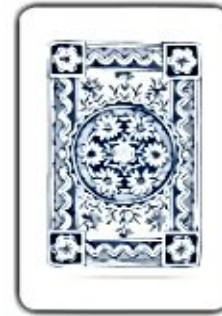
У медведя в бору

Вот лягушки по дорожке скачут, Вытянувши ножки, Ква-ква-ква-ква-ква, Скачут, вытянувши ножки.