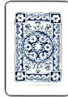
У медведя в бору

Вот лягушки по дорожке скачут, Вытянувши ножки, Ква-ква-ква-ква-ква, Скачут, вытянувши ножки.