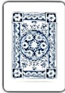
Сова и мышата