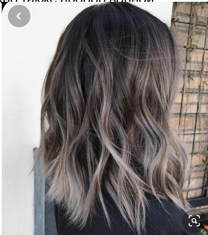
Растяжка по цвету и волна

Загадочность и асимметричность в чертах лица подчеркнем сложным цветом. Поскольку лицо с холодным подтоном, то выбираем холодный пепельный подтон в волосах. Каштановый оттенок подчеркивает все неровности кожи и придает возраст. Можно сделать растяжку по цвету, станет еще интереснее. Главное, хороший мастер по волосам. Природная волна подчеркнет лиричность и загадочность, поэтому рекомендую укладывать и делать волну или легкие локоны. Стрижка может быть ассиметричной или каскадом, никаких ровных срезов, пробор ассиметричный, не четко посередине, можно также пробор волной