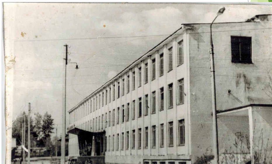
Школа № 2