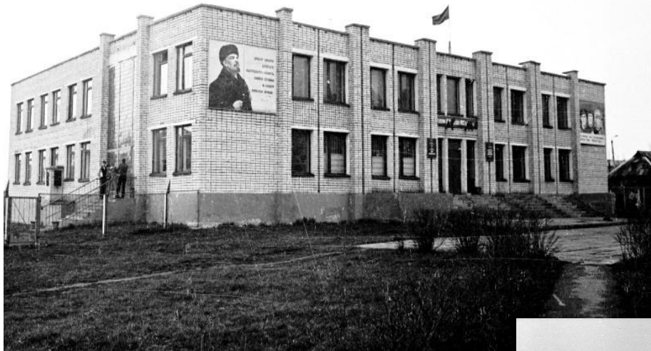
Военный комиссариат г. Шумерля