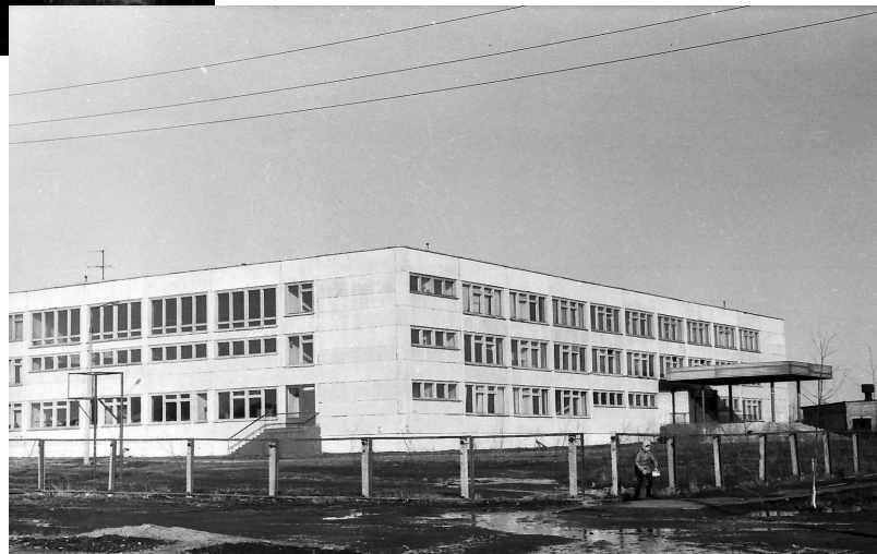
Школа № 6