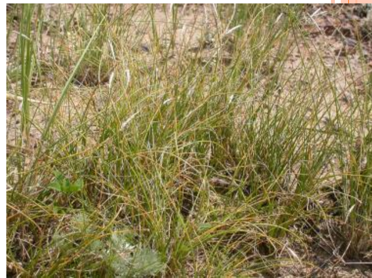
Узкие, мелкие листья