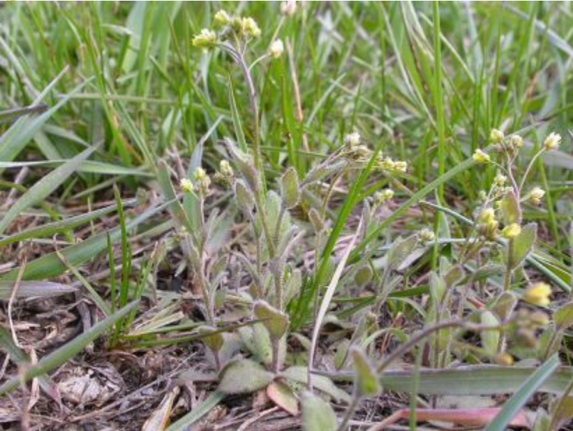
Крупка дубравная с опушенными листьями