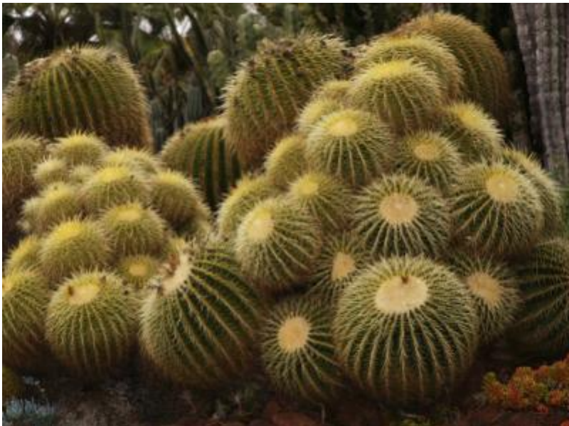
Шипы для уменьшения испарения