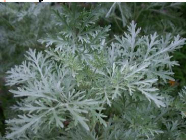
Бледные листья и стебли