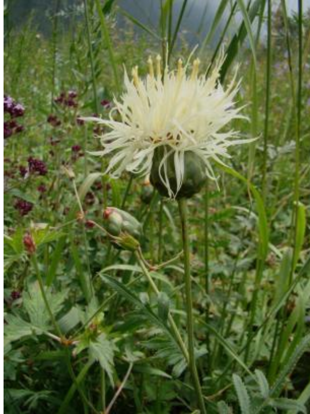
Василек с восковым налетом на листьях