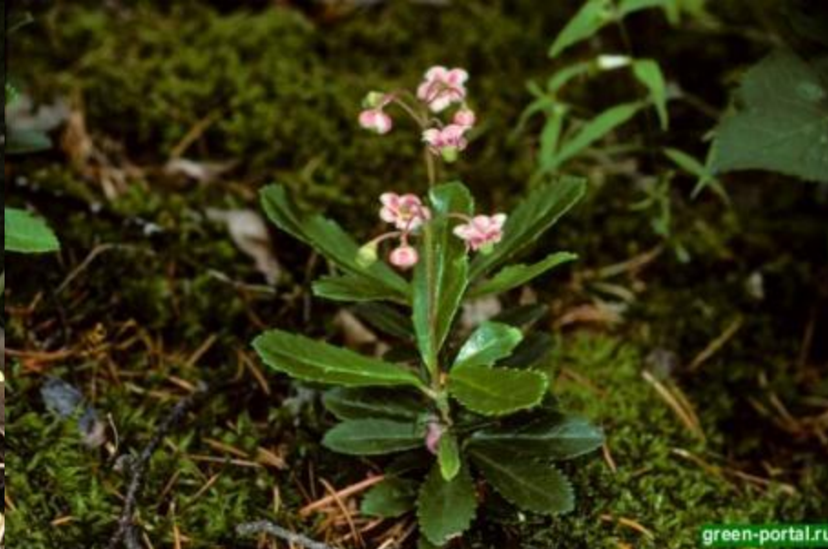
Зимолюбка с мелкими семенами