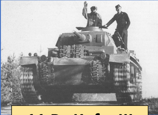
11 Pz.Kpfw.III Ausf.H