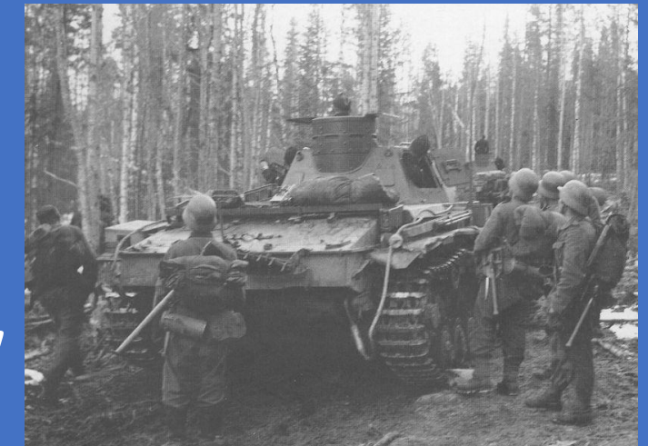
4 Pz.Kpfw.III Ausf.D