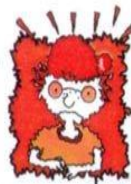
Дрожь в теле