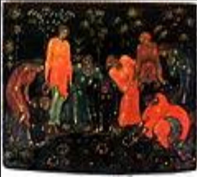
Иван Голиков «Гадание на венках» (1920-е годы)