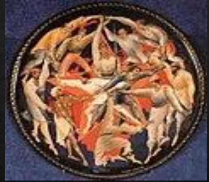
Иван Голиков «Третий интернационал» , 1927 год