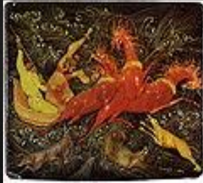
Иван Голиков «Тройка и волки». Миниатюра на портсигаре, 1924 год