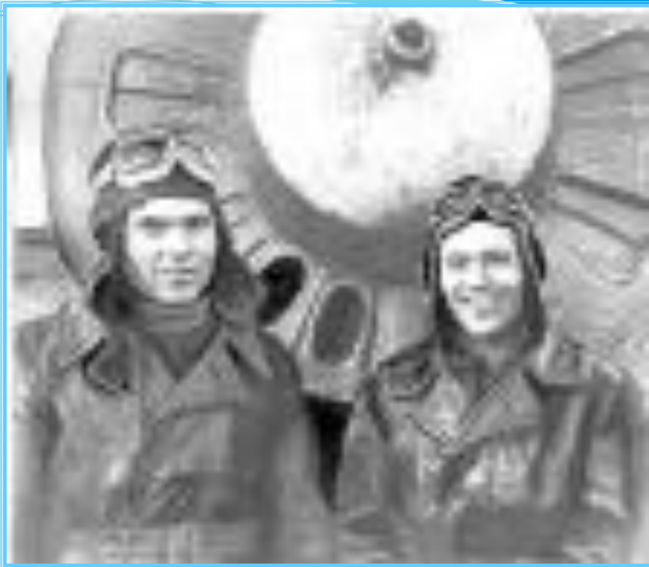
Твардовский А.Т. и поэт Алексей Сурков.