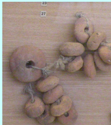
2. Грузила для сетей. Изготовлены из гальки с проделыванием в них отверстия