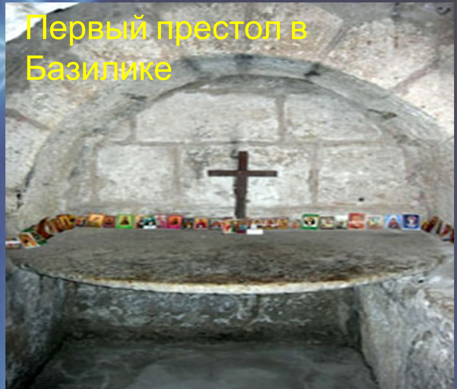
Первый престол в Базилике

Если выйти на улицу из южных дверей храма, то попадаешь в небольшой дворик, из которого можно спуститься в пещеру Вифлеемских младенцев. По преданию, в этой пещере были погребены младенцы, убиенные Иродом и почитающиеся как первые мученики за Христа. Также, в этой пещере находится самый древний православный престол, устроенный в Вифлееме.