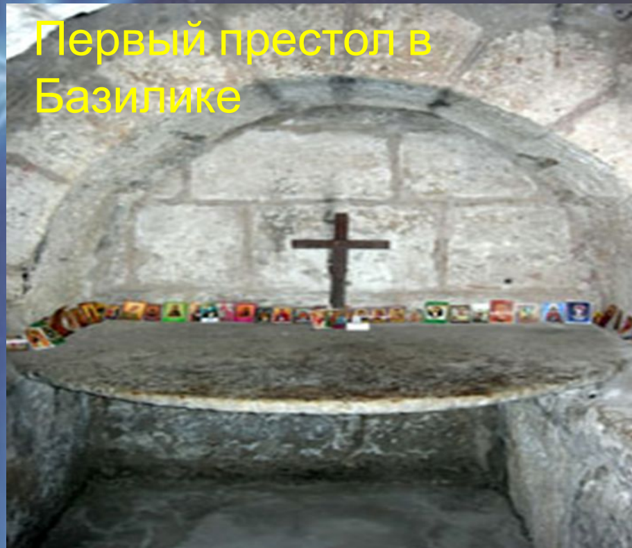
Первый престол в Базилике

Если выйти на улицу из южных дверей храма, то попадаешь в небольшой дворик, из которого можно спуститься в пещеру Вифлеемских младенцев. По преданию, в этой пещере были погребены младенцы, убиенные Иродом и почитающиеся как первые мученики за Христа. Также, в этой пещере находится самый древний православный престол, устроенный в Вифлееме.