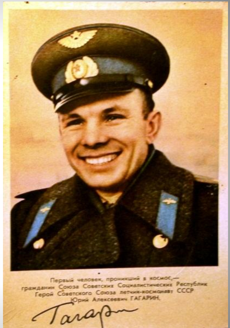
Первый человек, проникший в космос,— гражданин Союза Советских Социалистических Республик Герой Советского Союза летчик-космонавт СССР Юрий Алексеевич ГАГАРИН.