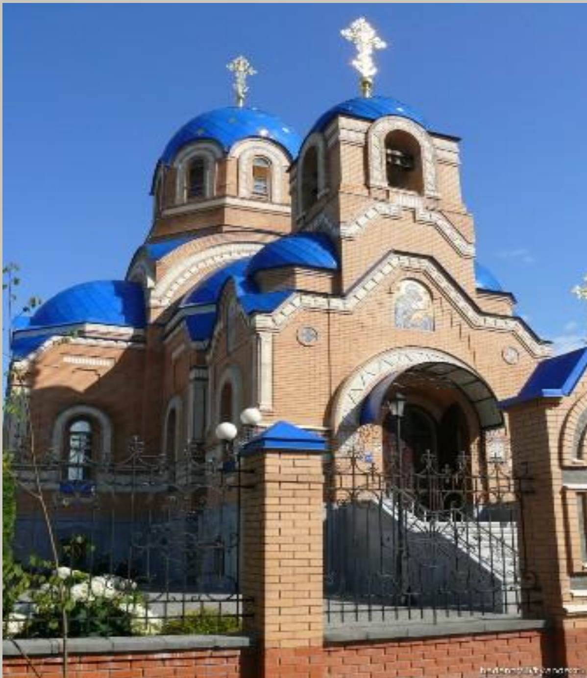
Храм Успения Пресвятой Богородиц ы