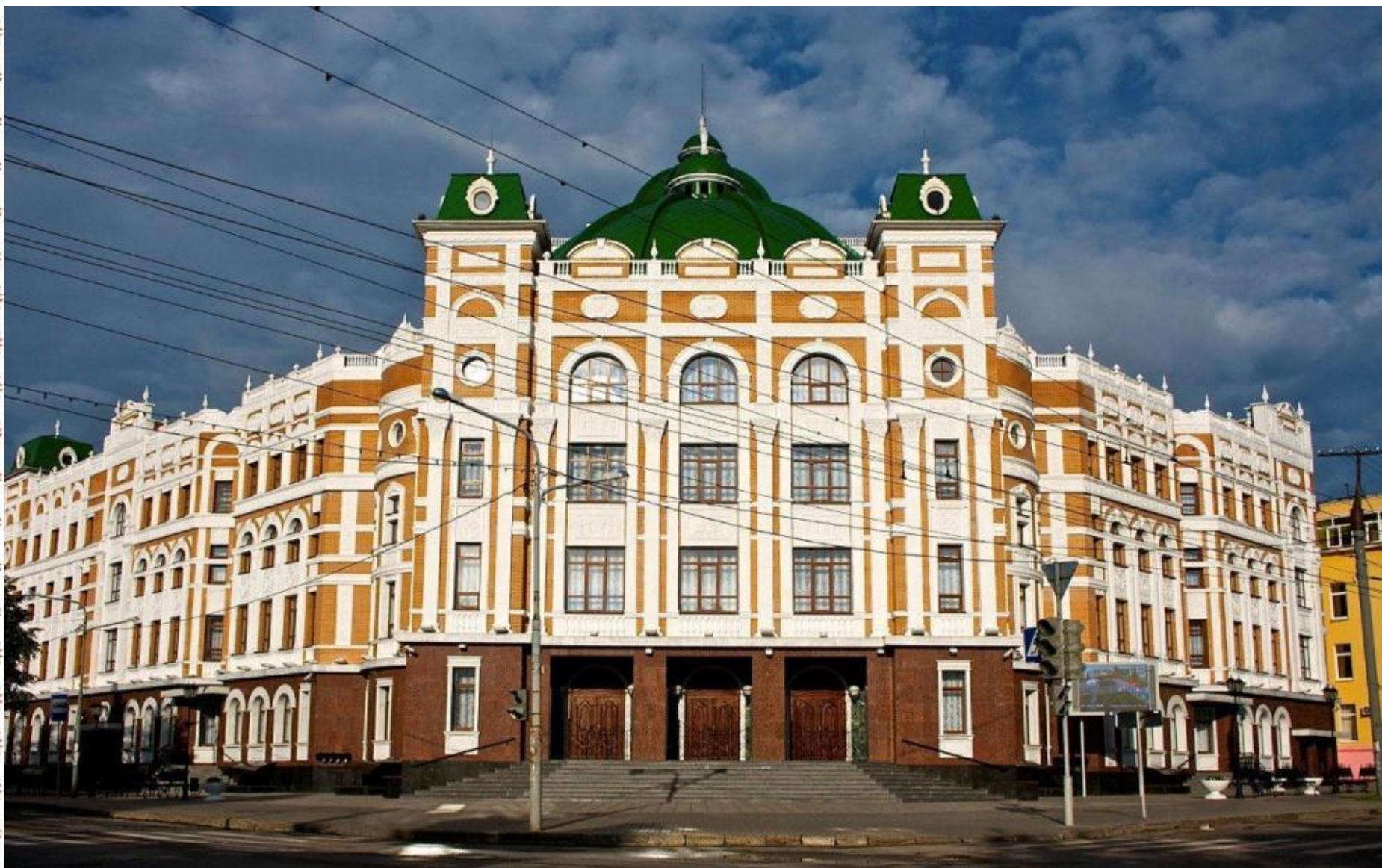
Театр оперы и балета им. Э. Сапаева