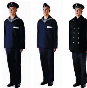
Повседневная форма одежды матросов и старшин ВМФ

Парадную форму одежды военнослужащие ВМФ носят во время парадов, официальных и торжественных мероприятий; в дни праздников воинской части; при получении государственных наград; при вручении воинской части Боевого знамени; при спуске корабля на воду; при подъёме Военно-морского флага на корабле; при назначении в состав почётного караула;