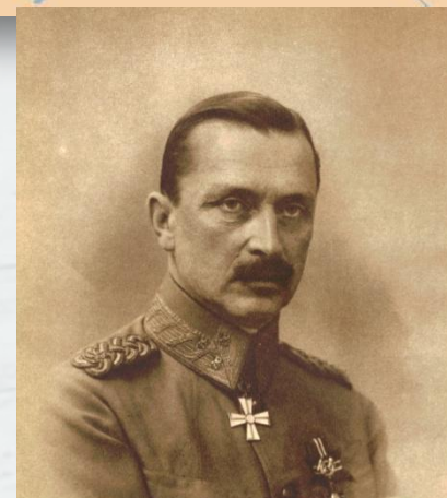
К. Г. Маннергейм