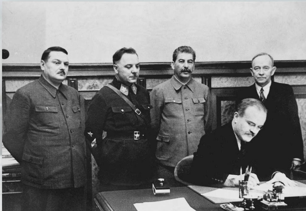
В. М. Молотов (министр иностранных дел СССР) подписывает мирный договор с Финляндией со стороны Советского Союза

Зимняя война долгое время была «незнаменитой». Из-за немалых потерь её старались замалчивать. Это несправедливо по отношению к участникам тех событий. Ведь благодаря их мужеству, героизму и негибаемому духу государственная граница СССР была отодвинута до 150 км на запад , задачи выполнены. И сегодня, спустя 81 год, память о них жива.