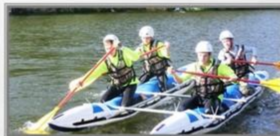
ПОХОД НА КАТАМАРАНЕ