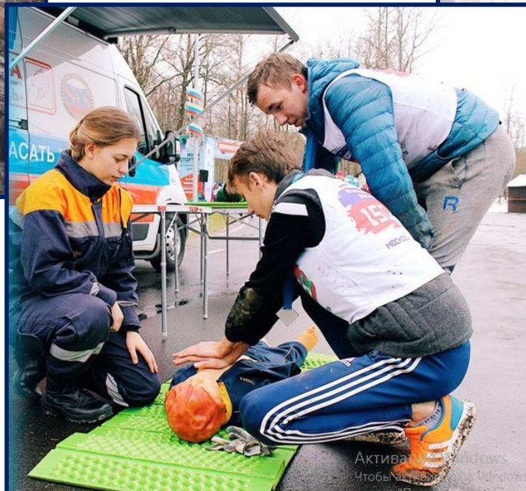
СЕРДЕЧНО – ЛЁГОЧНАЯ РЕАНИМАЦИЯ