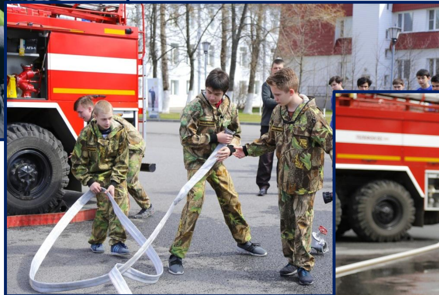
РАЗВЕРТЫВАНИЕ ПОЖАРНОГО РУКАВА