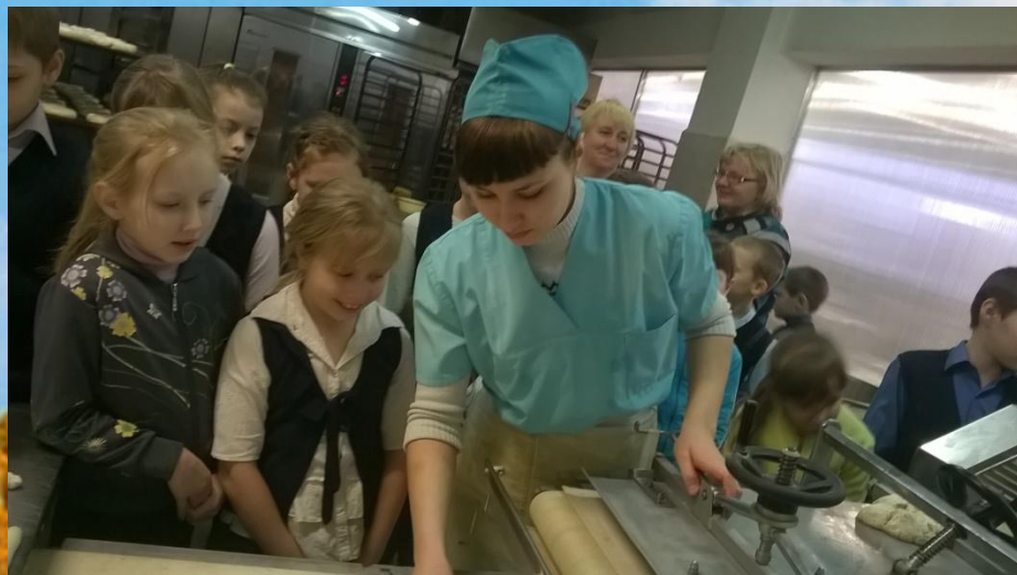
На пекарне «Топтыгин»