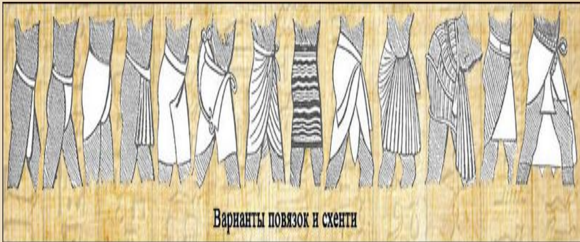
Варианты повязок и схенти