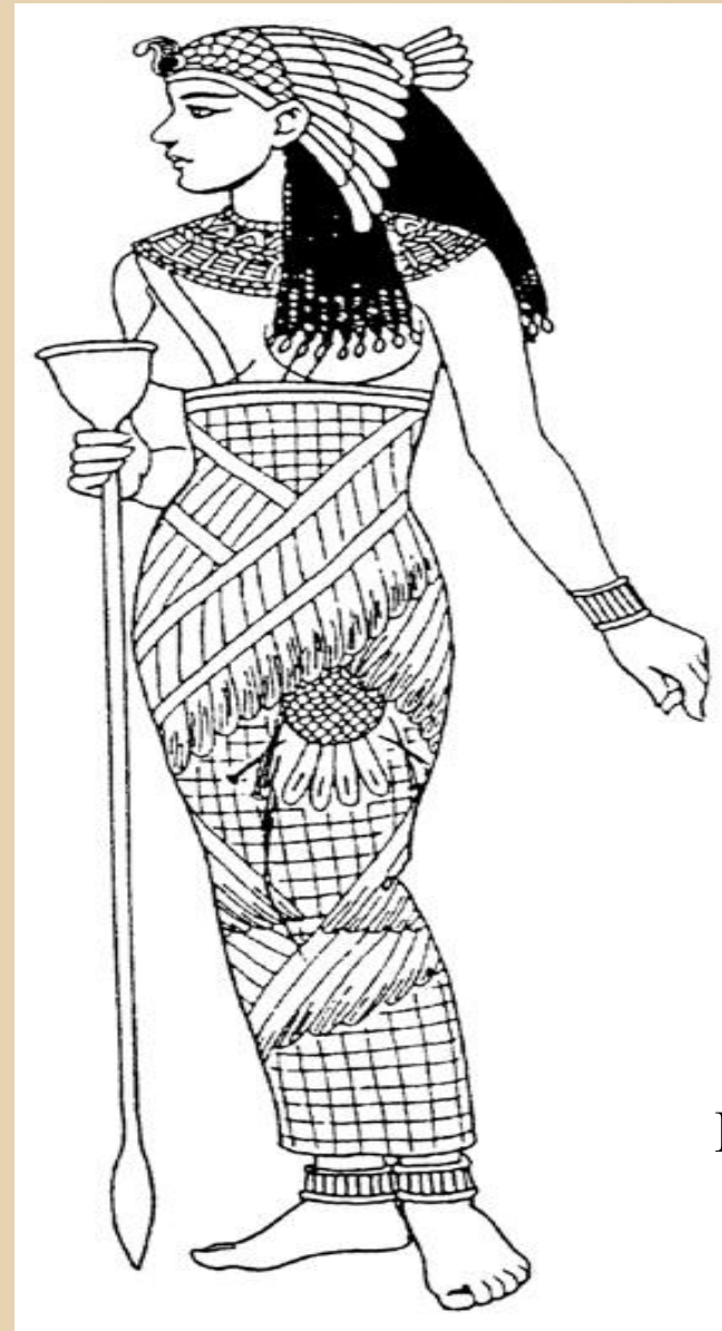
• Рис. б