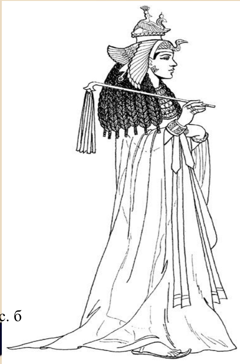
• Рис. б