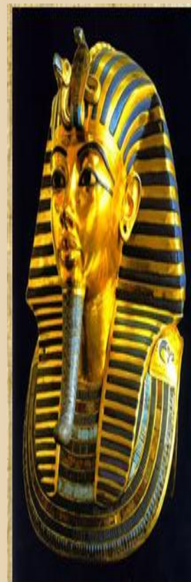
Урей на лбу маски Тутанхамона.

Роскошь, которую позволяла себе знать – ничто по сравнению с пышностью, которой окружали себя царственные особы. Фараон считался сыном самого бога солнца Ра, его особа обожествлялась. На божественное происхождение и неограниченную власть указывала особая символика – обруч со змеёй-уреусом, укус которой приводил к неизбежной смерти. Золотая змея-уреус обвивала царственный лоб так, что голова страшной змеи находилась в центре. Изображениями змеи и коршуна украшались не только головная повязка фараона, но и корона, пояс и шлем. Все атрибуты власти обильно украшались золотом, цветной эмалью и драгоценными камнями.