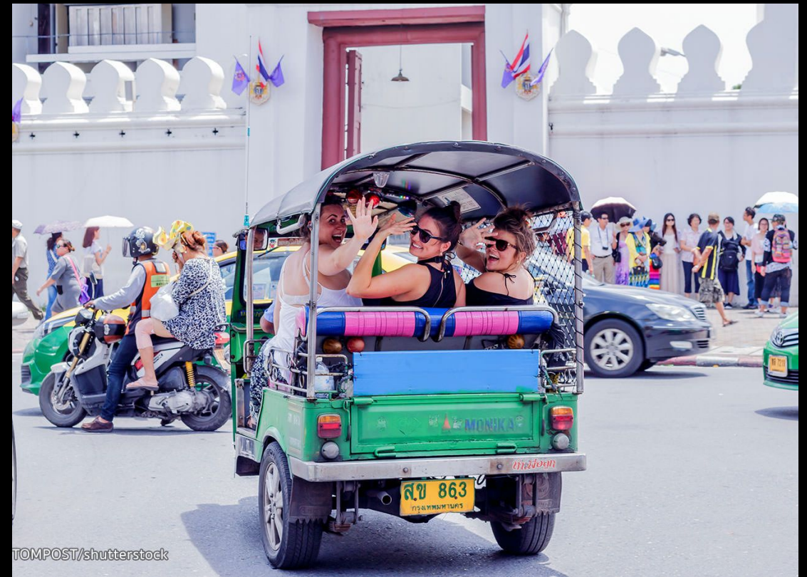
Тук - Тук