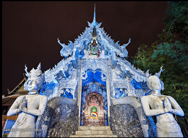
Ват Сри Супхан. Серебряный храм