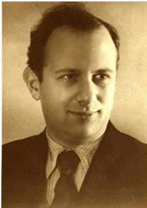
Болеславский И. гроссмейстер СССР ХБ0 Фр. р. на Л. 87567 цена 2р 50 тир. 3000