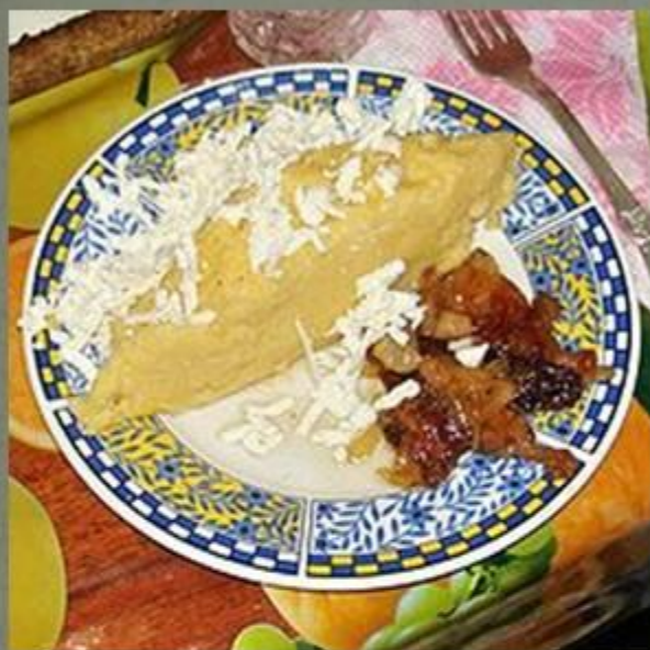
Мамалыга с брынзой и шкварками

Молдавская кухня — национальная кухня Молдавии. Молдавия расположена в регионе богатых природных возможностей, винограда, фруктов и разнообразных овощей, а также овцеводства и птицеводства, что обуславливает богатство и разнообразие национальной кухни.