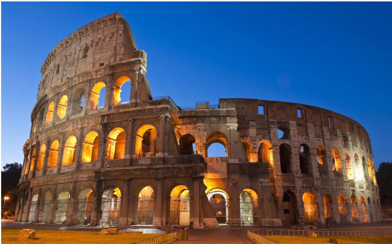
Колизей. 72 год

Архитектура - (от греч. architekton – строитель), искусство строить. совокупность зданий и сооружений, создающих пространственную среду для жизни и деятельности человека