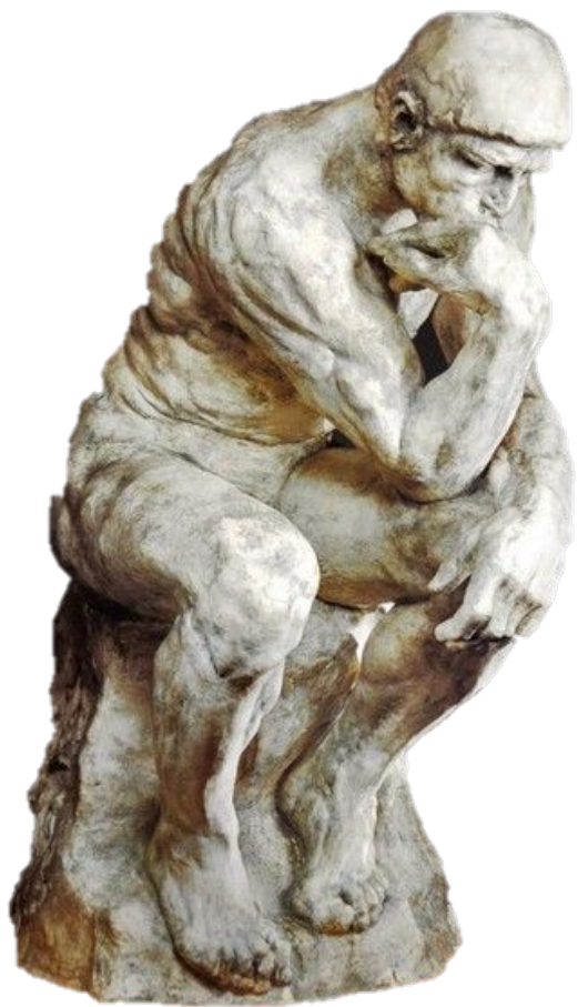
О. Роден. Мыслитель 1880—1882

Скульптура - (лат. Skulptura, skulpo- вырезать, высекать, ваяние, пластика) - вид изобразительного искусства, произведения которого имеют материальный трехмерный объем.