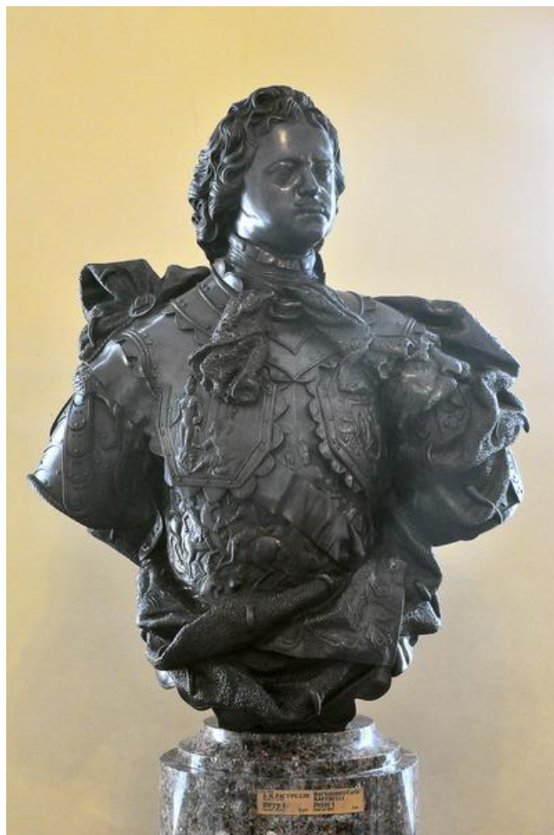
К.Б. Растрелли. Портрет Петра