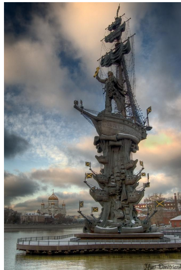
З. Церетели. Памятник Петру