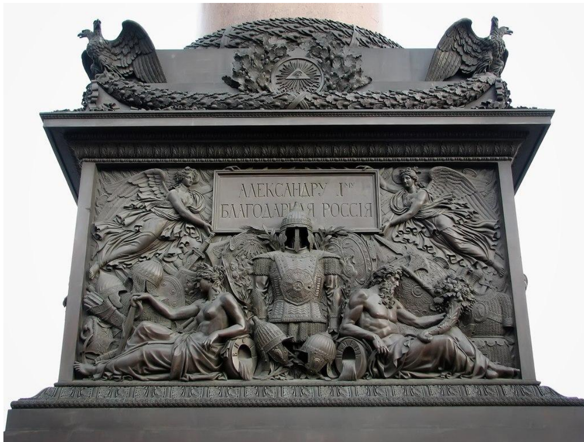
И. Леппе. Рельеф пьедестала Александровской колонны. 1834

Скульптура подразделяется на Объемная- скульптура, которую можно рассмотреть со всех сторон Рельеф- выпуклое изображение выступающее над плоскостью фона