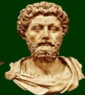
Марк Аврелий (121-180)

Автаркия (греч., αὐτάρκεια ) – самодовление, самодостаточность.