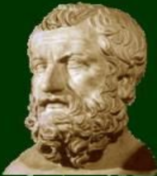
Зенон из Кития (336-264)