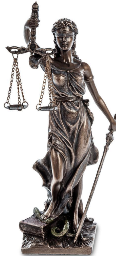
Богиня правосудия Фемида