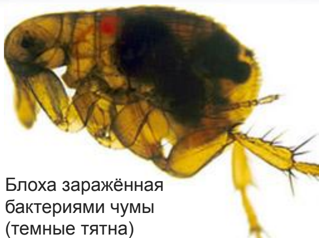
Блоха заражённая бактериями чумы (темные тятна)