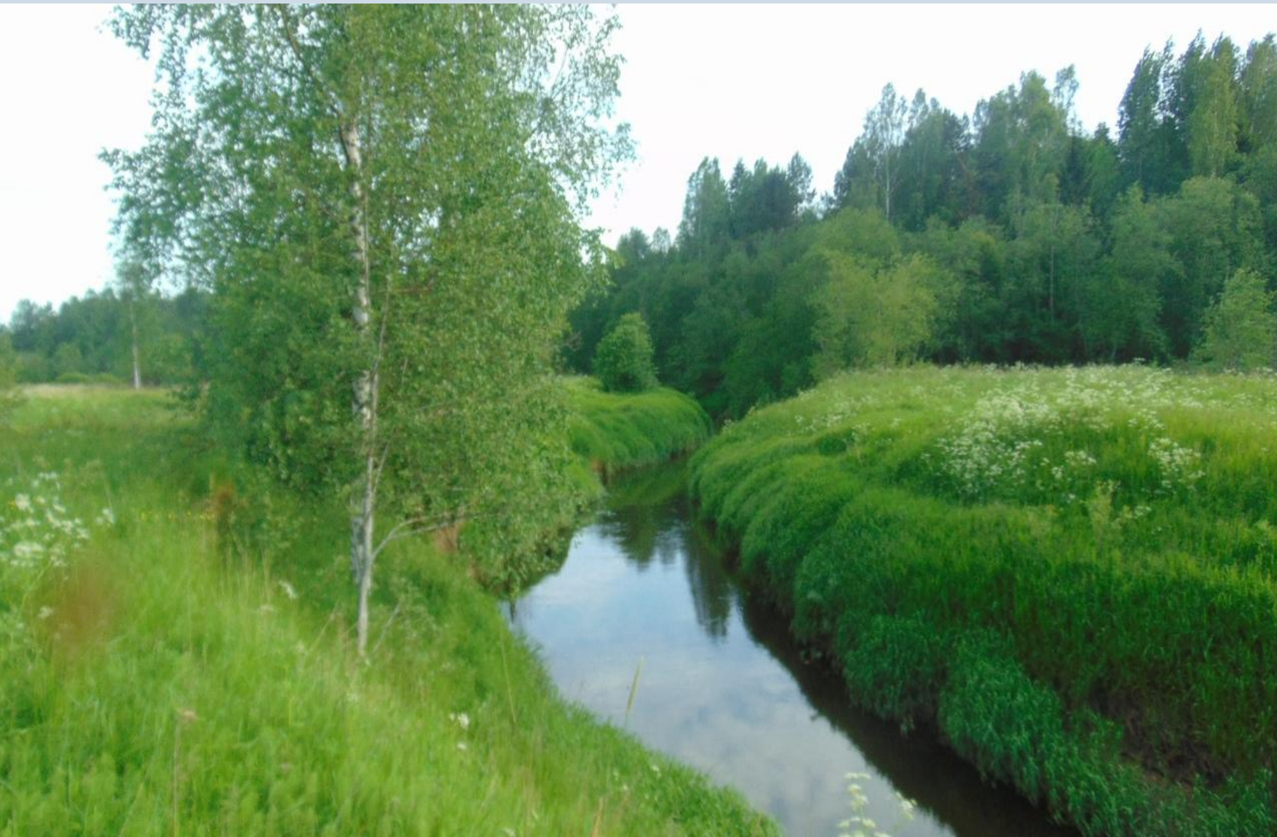
Река Берёза в окрестностях д. Дубровка. 11 июля 2020