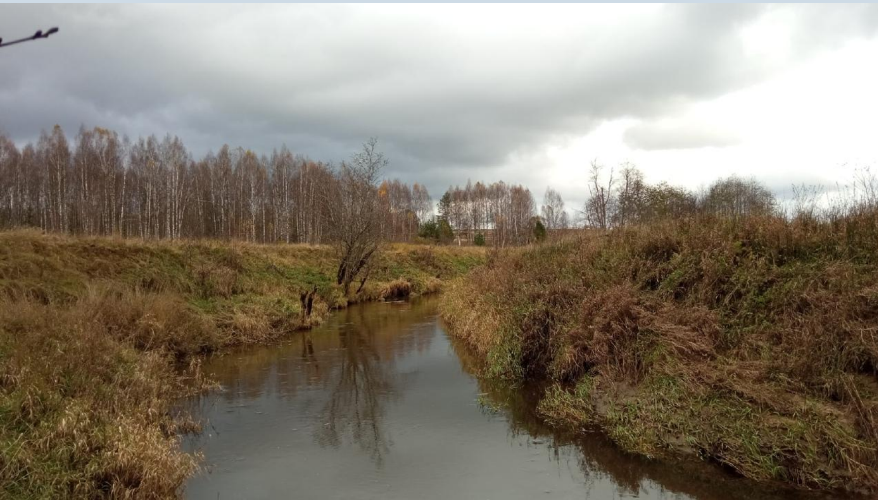
Река Берёза в окрестностях д. Дубровка. 28 октября 2020