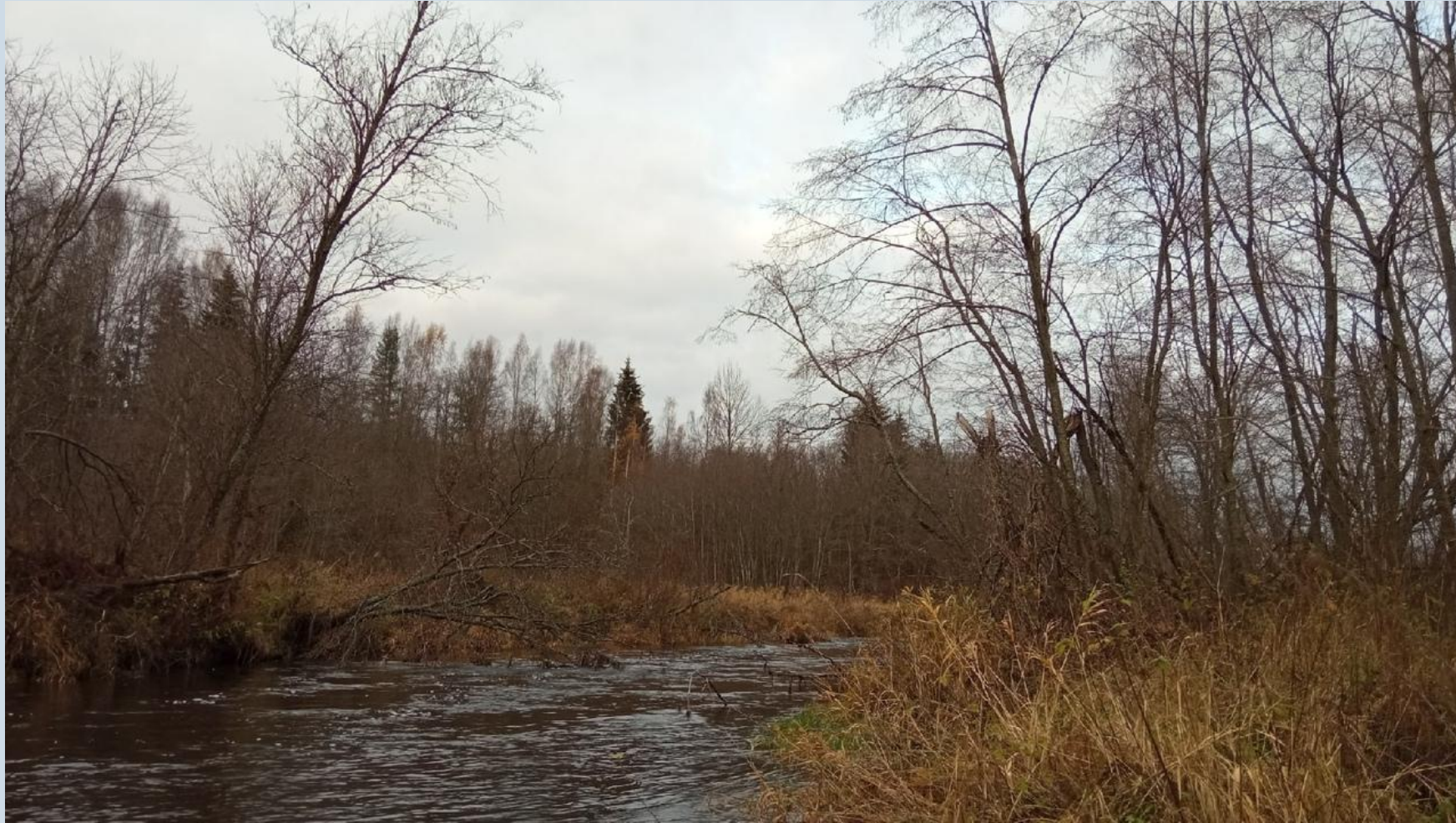
Река Витка около д. Швецово. 28 октября 2020