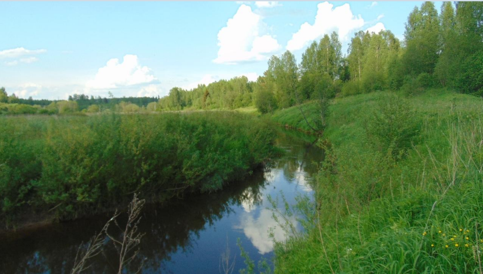
Река Витка около д. Швецово. 6 июля 2020