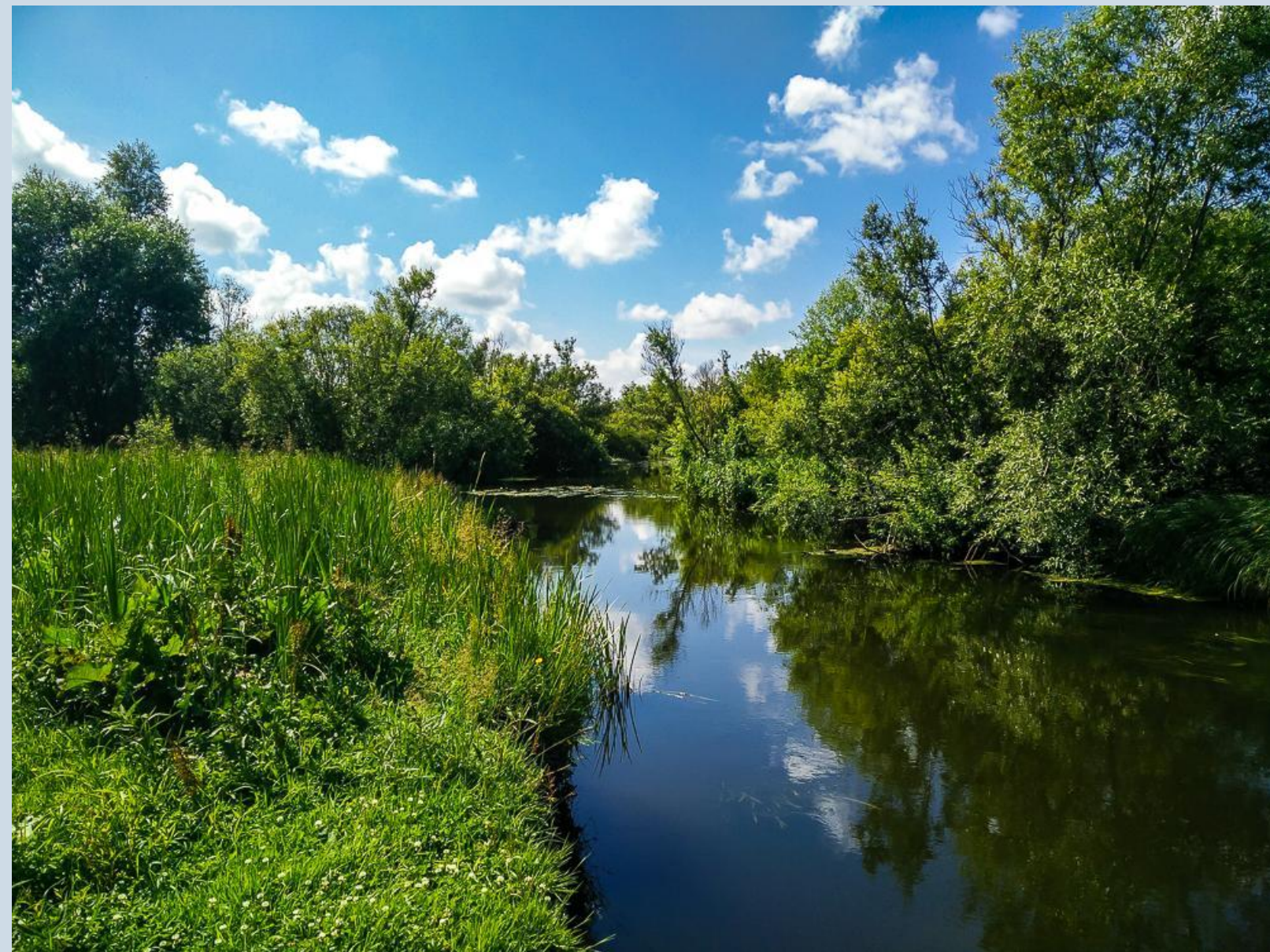
Река Лучеса, окрестности д. Гончаровка. 1 июля 2020