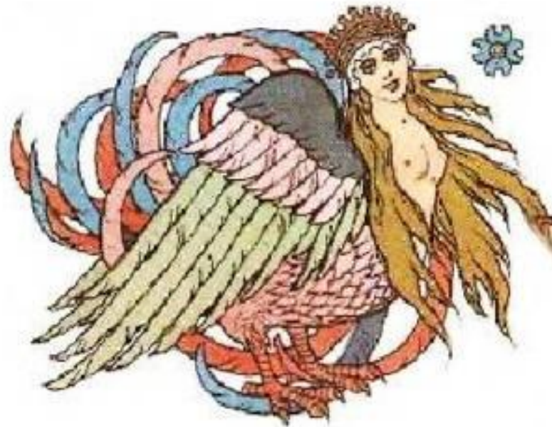
Иван Билибин «Алконост»

По сказанию 17 века Алконост пребывает близ рая и когда поет, то сама себя не ощущает. Алконост утешает своим пением святых, возвещая им будущую жизнь. Алконост несёт яйца на берегу моря и, погружая их в глубину моря, делает его спокойным на 7 дней. Пение Алконоста настолько прекрасно, что услышавший его забывает обо всём на свете.