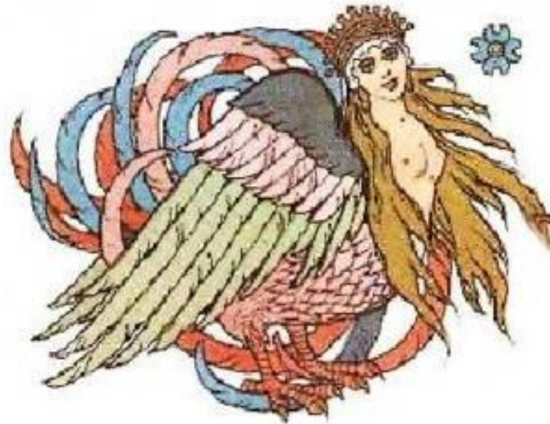
Иван Билибин «Алконост»

По сказанию 17 века Алконост пребывает близ рая и когда поет, то сама себя не ощущает. Алконост утешает своим пением святых, возвещая им будущую жизнь. Алконост несёт яйца на берегу моря и, погружая их в глубину моря, делает его спокойным на 7 дней. Пение Алконоста настолько прекрасно, что услышавший его забывает обо всём на свете.