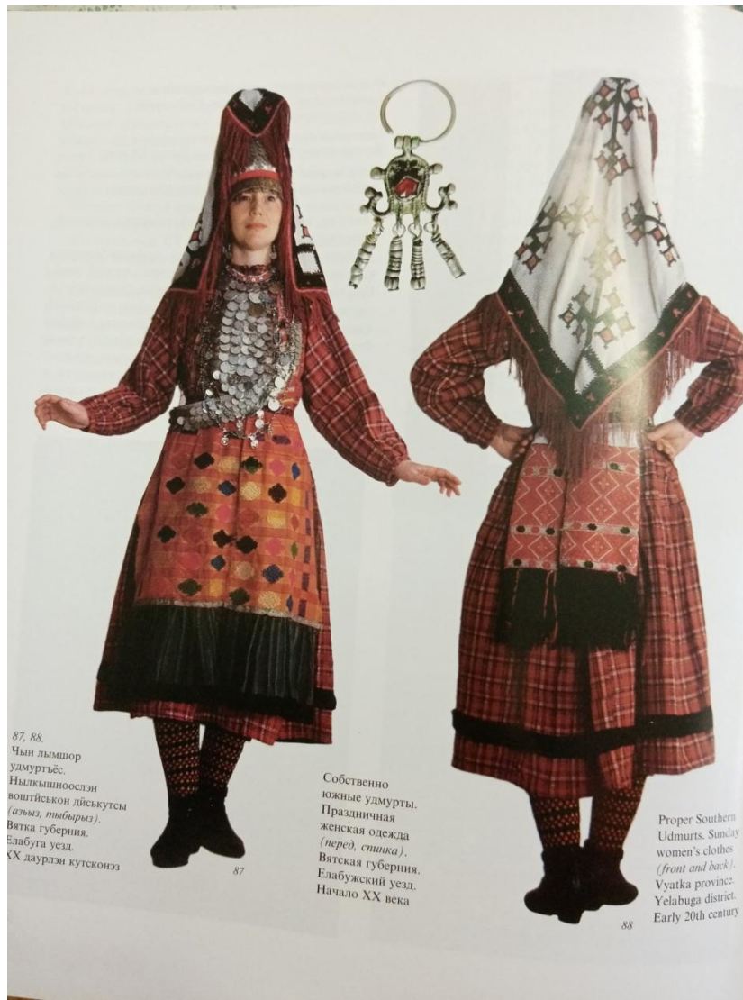
87, 88 Чын пымшор удмуртъяс. Нылкышноослэн воштӱськон дыськутсы (азьыг, тыбырыз). Вятка губерния, Елабуга уезд. XX даурлэн кутсконоз