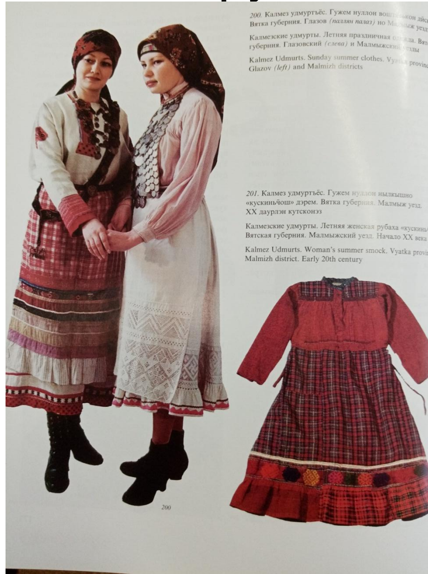
200. Калмез удмуртъёс. Гужем нуллон воштомакон дйську Вятка губерния, Глазов (палляи палаз) но Малмыж уездёс. Калмезские удмурты. Летняя праздничная одежда. Вятская губерния, Глазовский (слева) и Малмыжский уезды. Kalmez Udmurts. Sunday summer clothes. Vyatka province, Glazov (left) and Malmizh districts