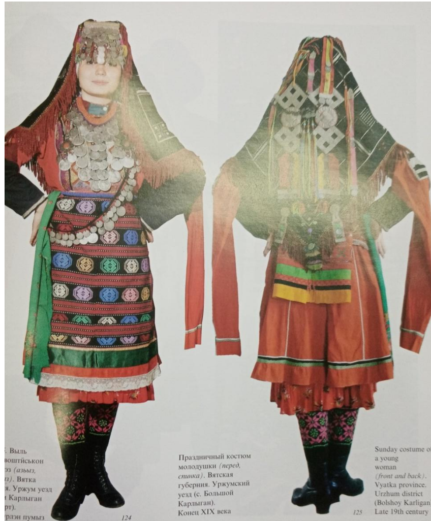
С выль- воштыськон из (азьыл, а). Вятка я. Уржум уезд Карлыган рт). рлзи пумыз