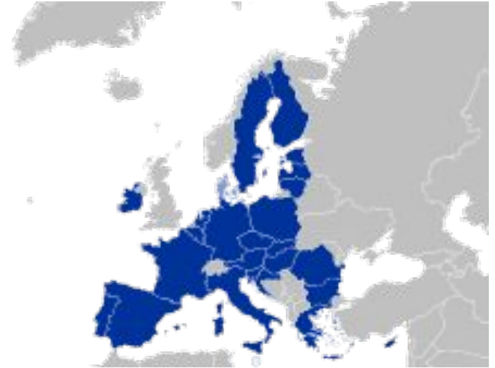
Карта государств, что подписали соглашение об участии в программе PESCO – см. в режиме просмотра

Первый случай, когда страны-члены ЕС реализуют подобный совместный проект, имеющий обязательную юридическую силу, а также обязуются увеличить расходы на оборону. История проекта связана с периодом формирования единой конституции ЕС