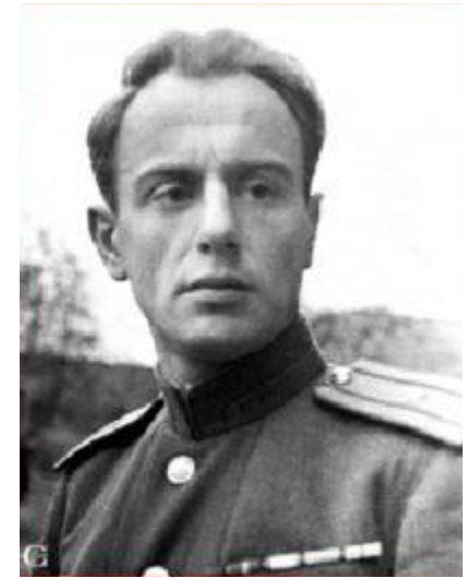
Поэт Евгений Долматовский