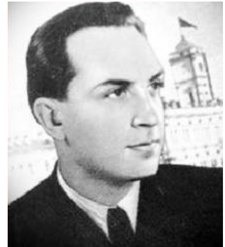
Композитор Марк Фрадкин