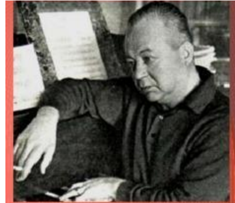
Композитор Никита Богословский