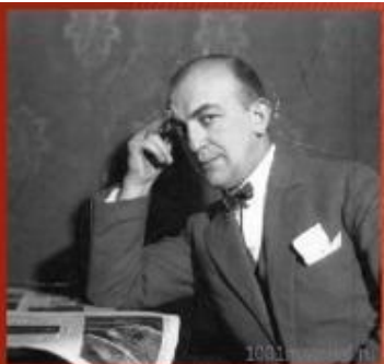
Композитор Ежи Петербургский