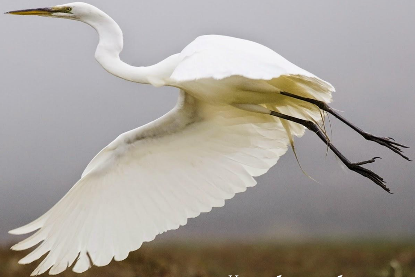
Цапля большая белая