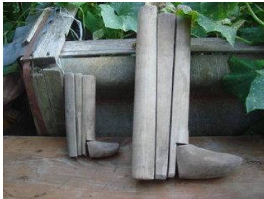
Колодки заводские и народных умельцев