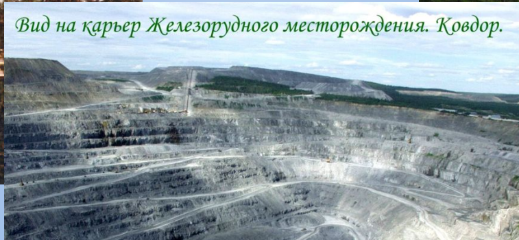
Вид на карьер Железородного месторождения. Ковдор.