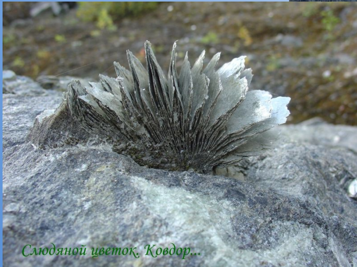
Слюдяной цветок, Ковдор...